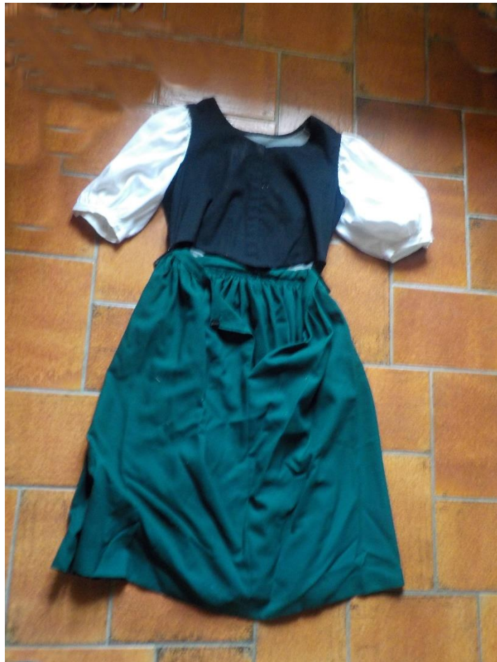
Ensemble de paysanne vaudoise.