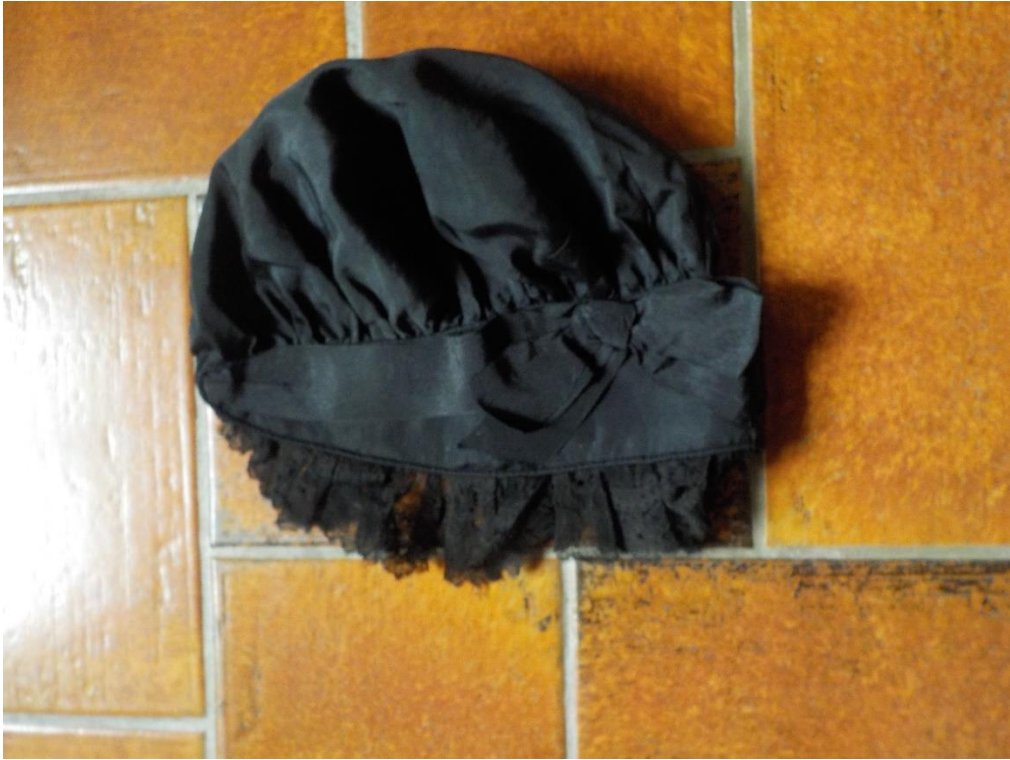
Coiffe de paysanne vaudoise.