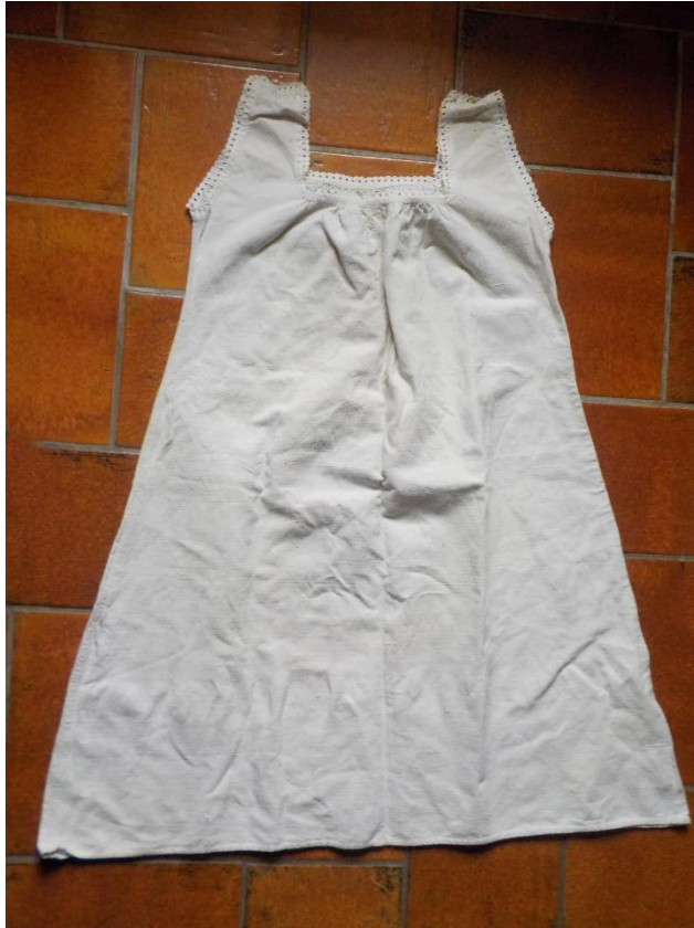
Combinaison dame, par deux pièces. Même problème de déterminer avec précision quel est le tissu.