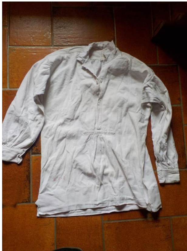
Chemise d'homme en lin.