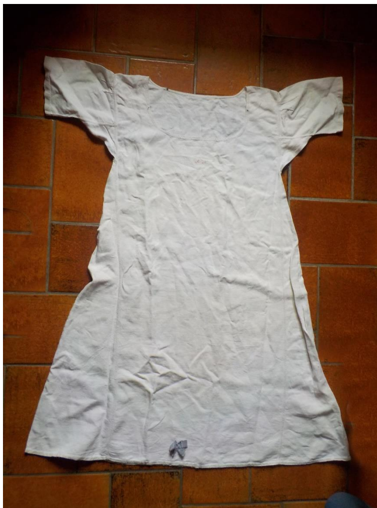
Chemise de nuit dame en lin ou en chanvre, la différence entre les deux tissus n'est pas toujours facile à déterminer.

Sachons voir, sachons acheter. Les collections, là-haut, n'attendent que cela. Car voilà, l'hiver fut calme, il s'agit maintenant de compenser. Il y a urgence !