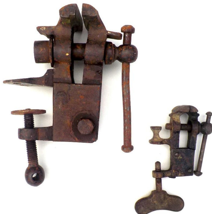
Deux petits étaux de table, le deuxième carrément minuscule.

Brocante du 10 juin 2023 – la razzia à des prix sans concurrence, presque au kilo ! – une sélection -