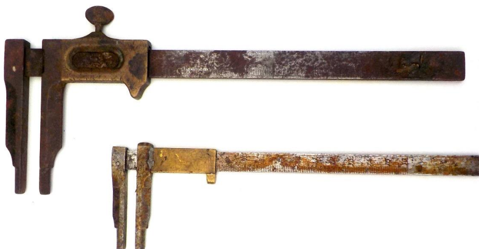
Deux pieds à coulisse.