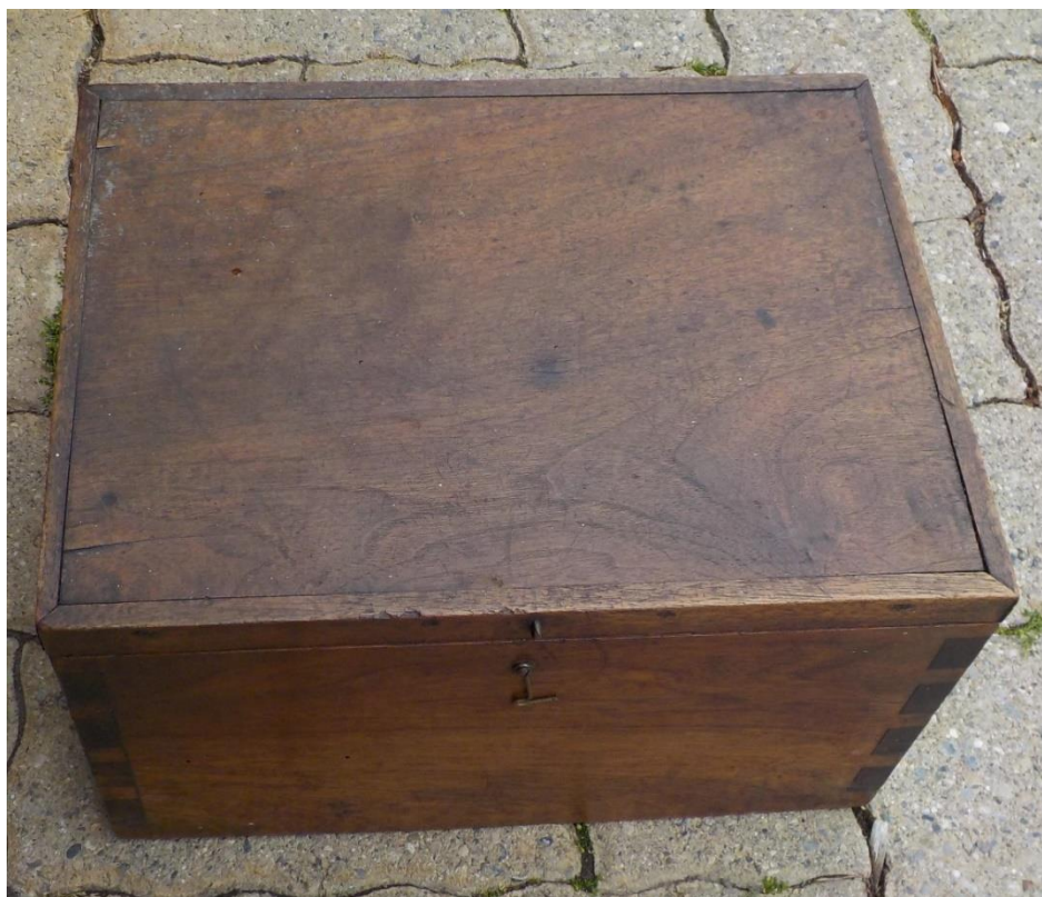
Un joli coffre en noyer n'est pas de refus.

On débute avec la brocante de juin 2019.