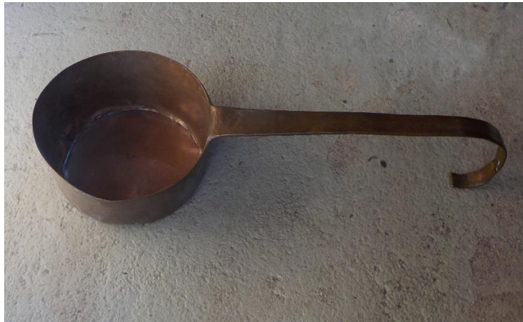
Longueur 40 cm environ.