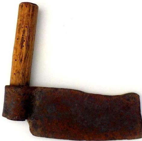
Deux fers à tavillons.