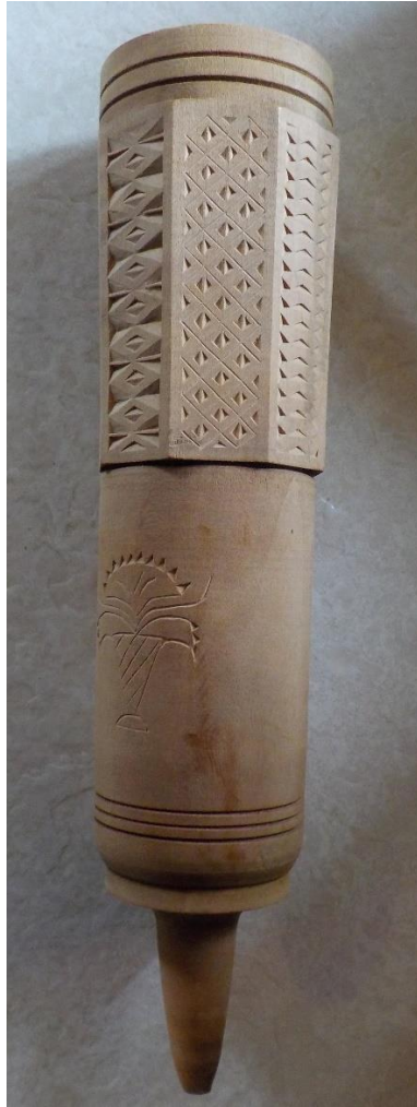
Comme ce cova valaisan.