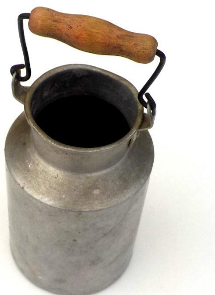
Bidon à lait modèle réduit.