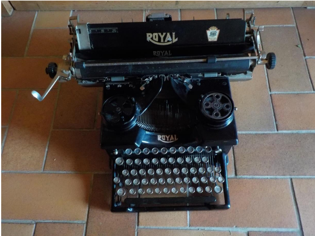
Machine à écrire marque Royal.