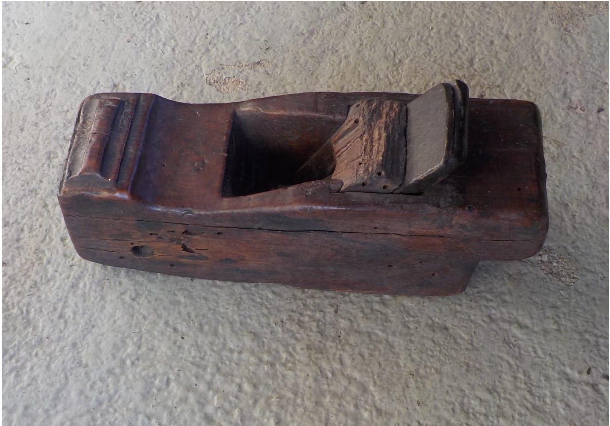
Les rabots sont innombrables. Celui-ci a pourtant son charme, et surtout son ancienneté.