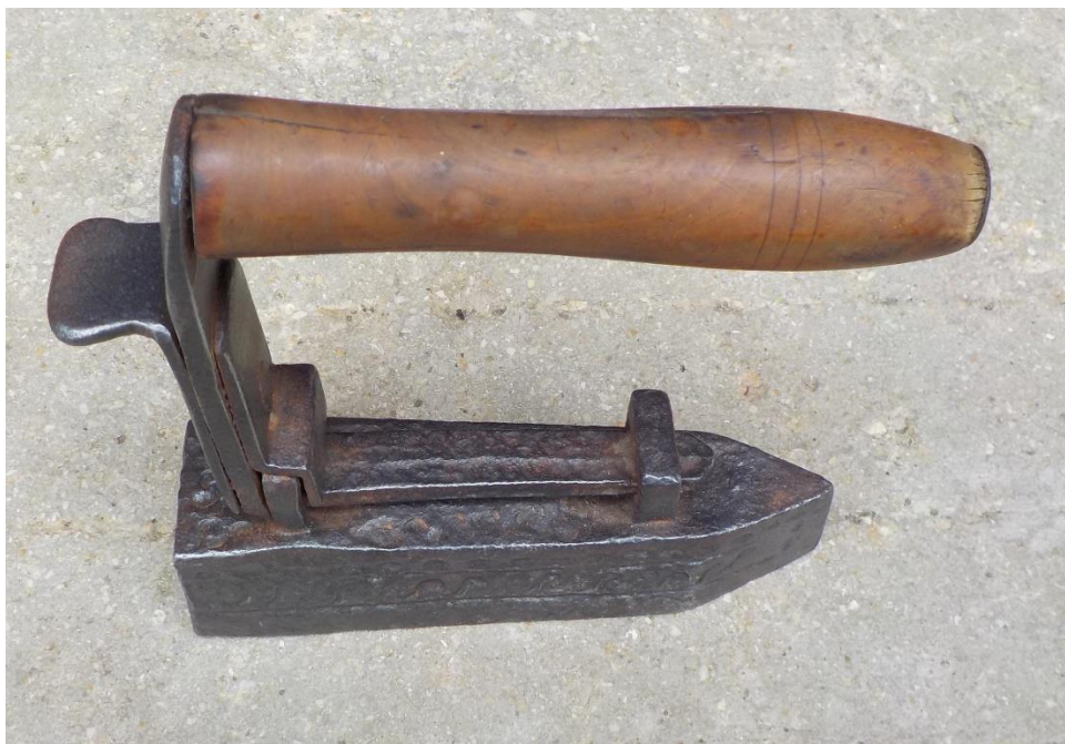
L'ancienneté de l'objet – fer à repasser – ne peut que nous séduire. En plus d'une qualité parfaite.