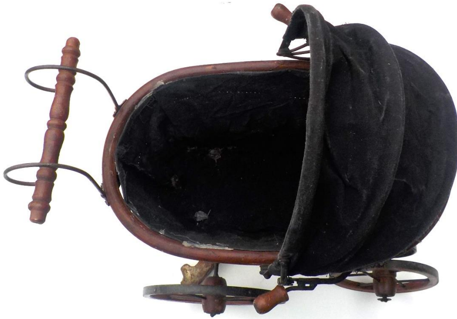
Poussette pour poupée.

Pour la brocante 2024, là aussi avec de superbes affaires, voir notre numéro 161. Et tout cela dans l'attente de celle de 2025 que l'on espère naturellement meilleur encore !