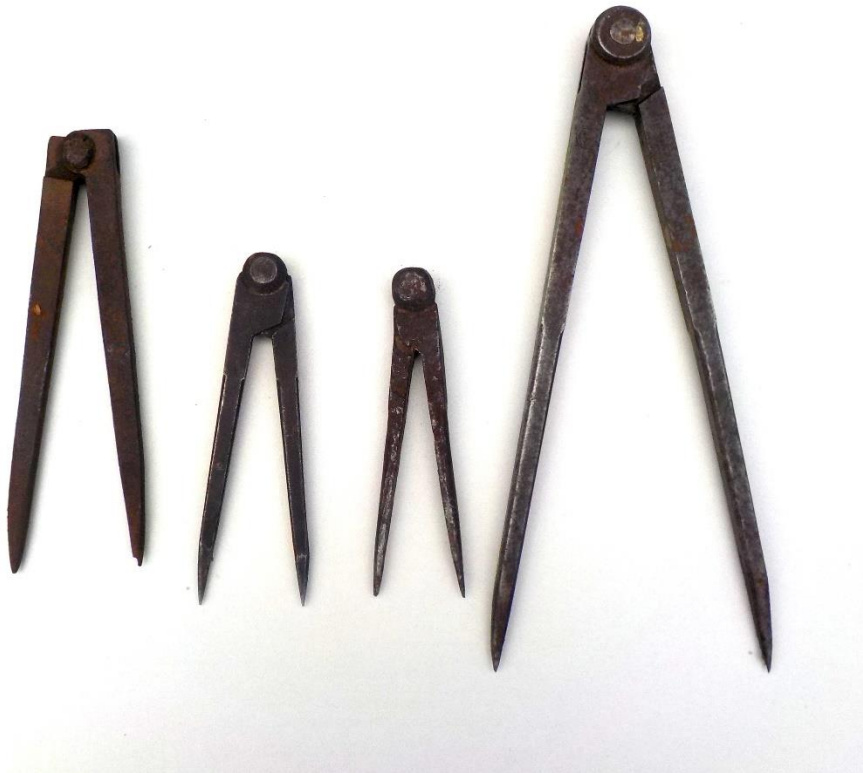
Quatre compas métalliques.