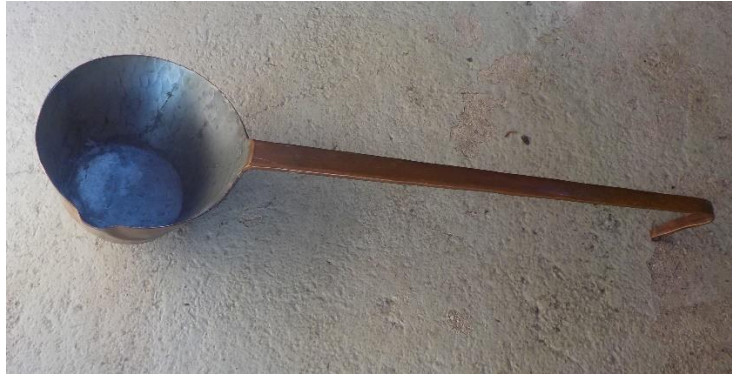
Deux poches en cuivre.