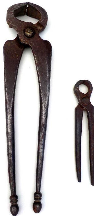
On aura toujours un faible pour les tenailles !