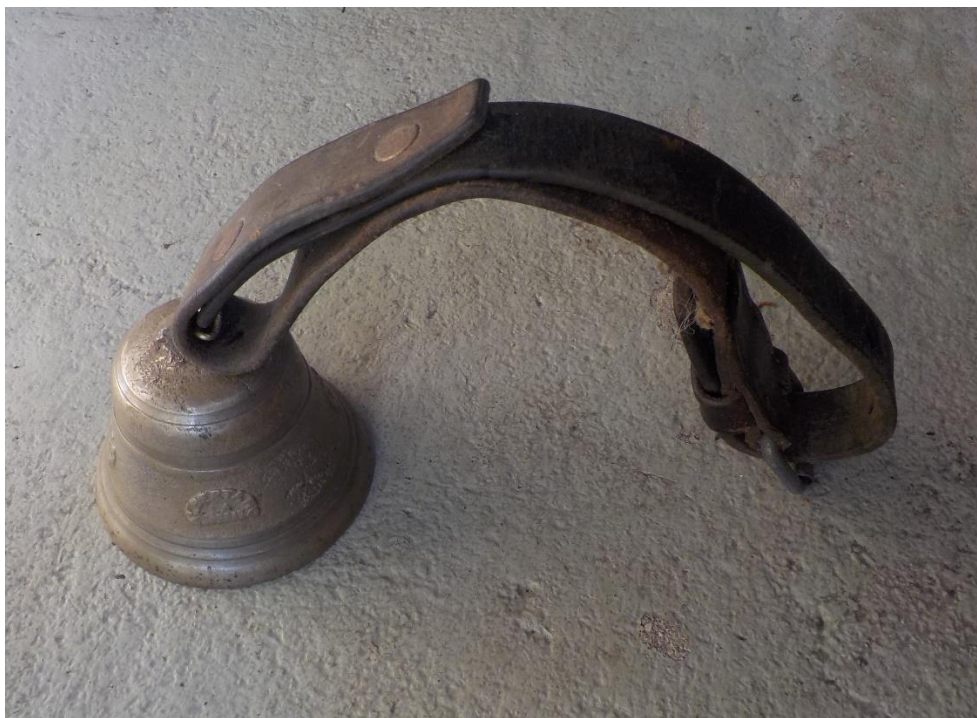
Clochette de veau Obertino de La Sarraz. Pour nous une belle courroie vaut toujours presque autant que la cloche elle-même.