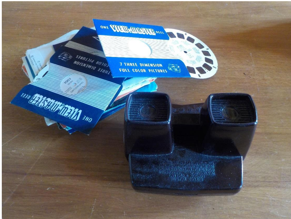
Wiev-master. C'était la mode de voir défiler ces images en 3 D. Paysages, animaux, l'effet était saisissant.

Et l'on saute à la brocante 2022, celle de 2020, du 11 juin, et sans doute aussi 2021, ayant été supprimées pour cause de covid. Une covid qui aurait fini par tout tuer.