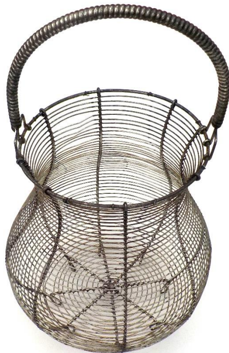
Panier à salade en fil de fer. On put aussi y mettre des œufs.