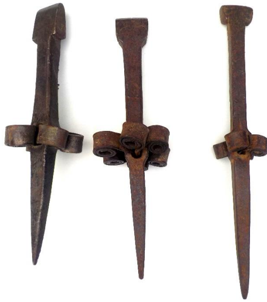
Fers à enchapler. Ils sont toujours magnifiques.