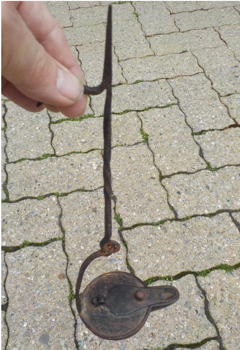
Lampe à huile.