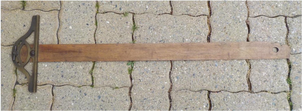
Un instrument de mesure pour géomètre.