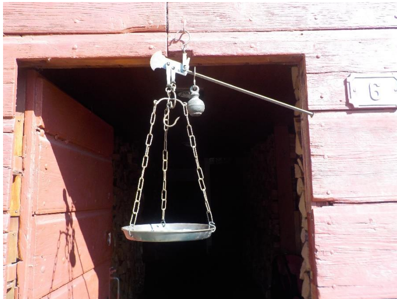
Romaine de ménage au Crêt-du-Puits 6 avant de gagner les dépôts du Patrimoine.

Et c'est tout pour 2022. Une brocante honnête, sans plus. Les petits ruisseaux font pourtant les grandes rivières !