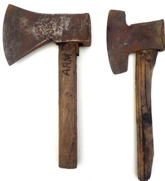
Haches, dont l'une à équarrir.