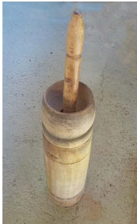
Très petite barate à piston. Presque un jouet.