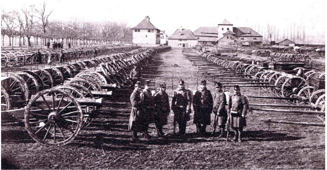
Dépôt d'artillerie à Yverdon en février 1871. L'impressionnant matériel Bourbaki aligné au mm !