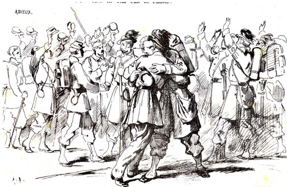
Le départ des rapatriés. On avait noué de solides amitiés sans néanmoins la possibilité de ne jamais se revoir un jour.