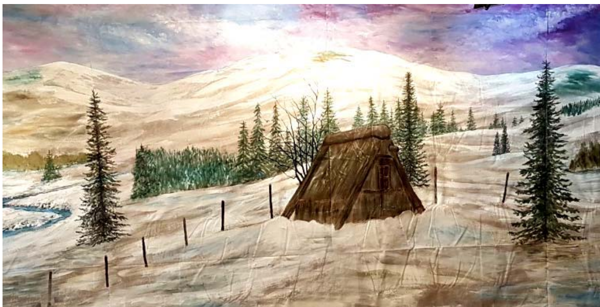
La fresque Depallens.