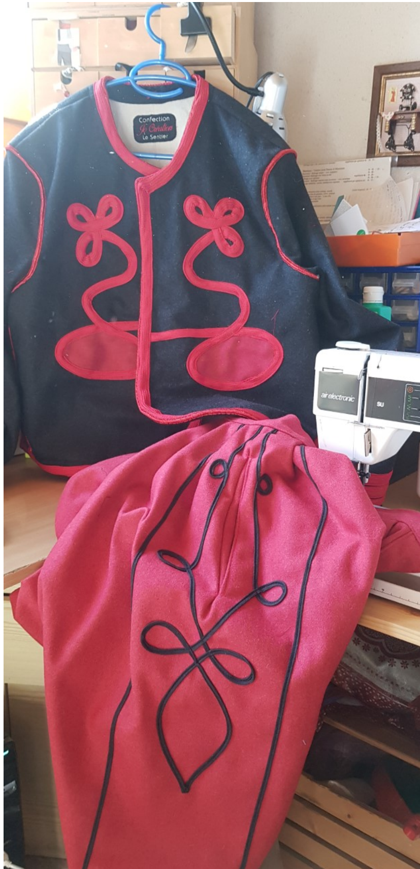
L'uniforme en préparation dans l'atelier de Mme Joëlle Vuilloud.