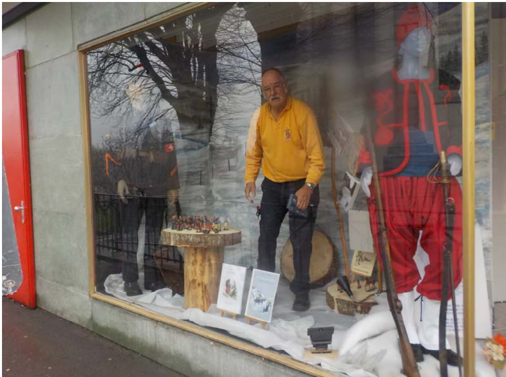
Les soldats de plomb – qui ne sont pas en plomb ! – et les bouquins font bon ménage. Si vous voulez acheter le livre sur les Bourbakis récemment édité, adressez-vous aux Caves du Pèlerin, 1343 Les Charbonnières.