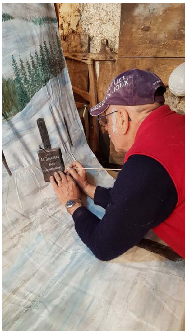
L'artiste à l'œuvre dans son atelier du Poste aux Charbonnières.