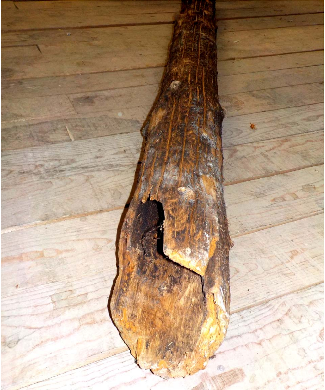
Le tuyau du Patrimoine. Il a vécu, dirons-nous !