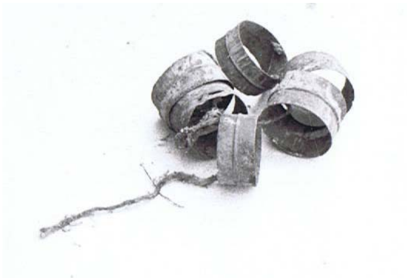
Anciennes boîtes mises en collier avec une ficelle.