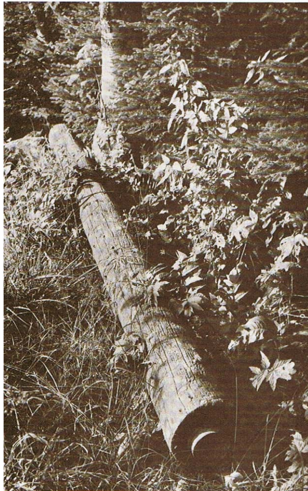
Le tuyau avec en bout la boîte, qui servira de jonction entre deux éléments.

On aura trouvé d'autres renseignements sur le tuyau de bois et sa fabrication au no 3 de notre rubrique : Citerniers et fonteniers, par Auguste Piguet. Empruntons encore une photo à l'ouvrage de M. J.-F. Robert :