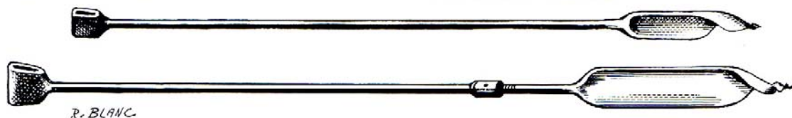
Fig. 21 Grands perceurs à tuyaux. En haut, perceur ordinaire à tuyaux (diamètre de la poche 4,5 cm). En bas, perceur à poche interchangeable pour tuyaux d'aspiration (diamètre 12 cm).