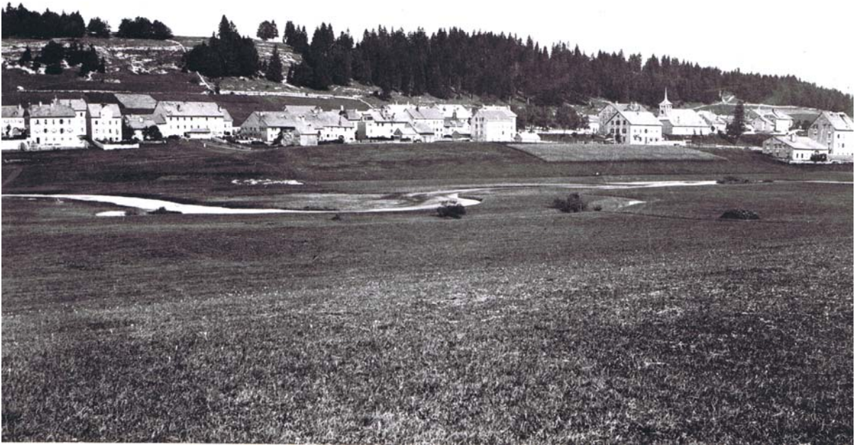
Le Sentier tel qu'il se présentait lors du passage des Bourbakis. Rajoutez la neige et vous serez dans le vrai.