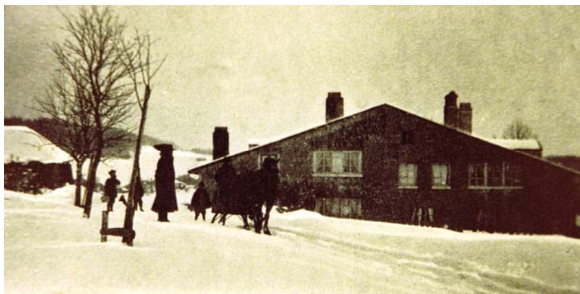
Chez Charles-Gustave, près du Solliat, image saisissante de l'ambiance qui avait pu prévaloir lors du passage des réfugiés.