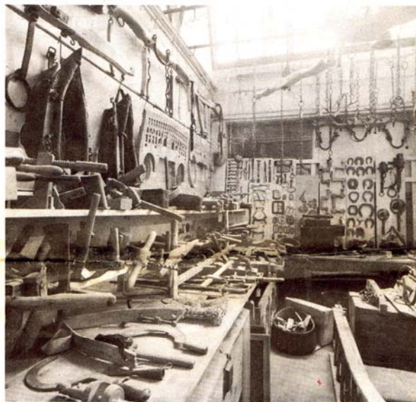
Une partie de la collection concernant en particulier le cheval.

objets, constituant en quelque sorte les «livrets de famille» de ces objets.