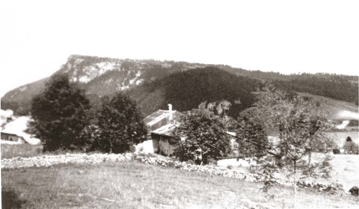
La Cornaz, voisinage de vent au centre.