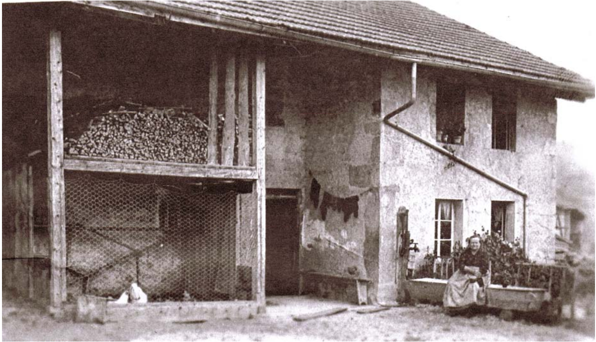
La nouvelle maison, avec la grand-mère Emma près de la pompe.