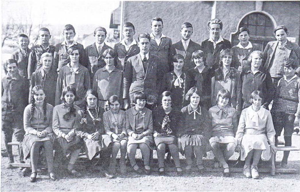
Classes : 1928 - 1929 - 1930