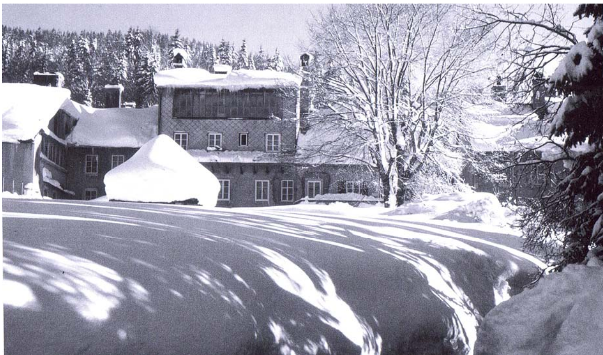
A gauche, le pignon dans lequel on découvre les sept fenêtres de l'atelier de Paul Reymond. Photo Daniel Aubert qui nous a fourni les documents ci-dessus.