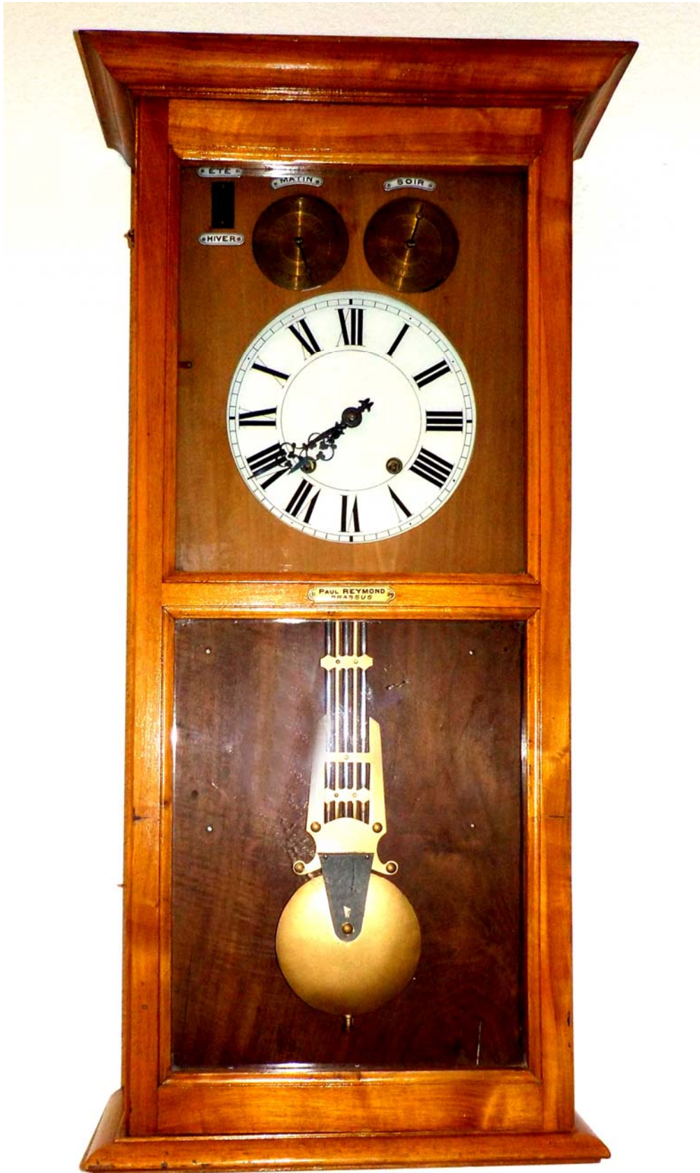
708. Pendule de l'école des Charbonnières déposée à l'heure actuelle au bureau communal du Lieu. Fournie par Paul Reymond en 1905 (selon note ci-dessous) en même temps que les pendules du Lieu et du Séchey. Celle du Lieu a disparu mystérieusement.