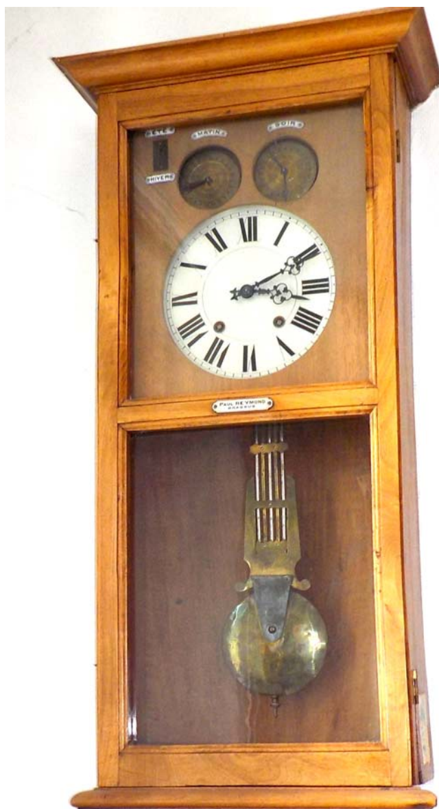
Pendule de l'école du Séchey.

Soit : 1905. A Raymond Paul au Brassus, pour fourniture de 3 régulateurs automatiques pour allumage des lampes publiques, 8980.- 2