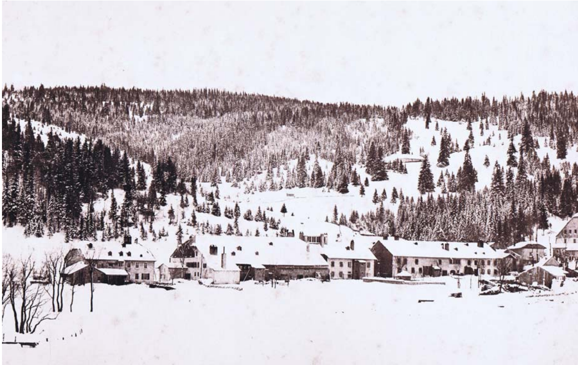
Le grand voisinage vu de l'arrière. L'atelier de Paul Reymond trouve ses fenêtres donnant sur le côté église.