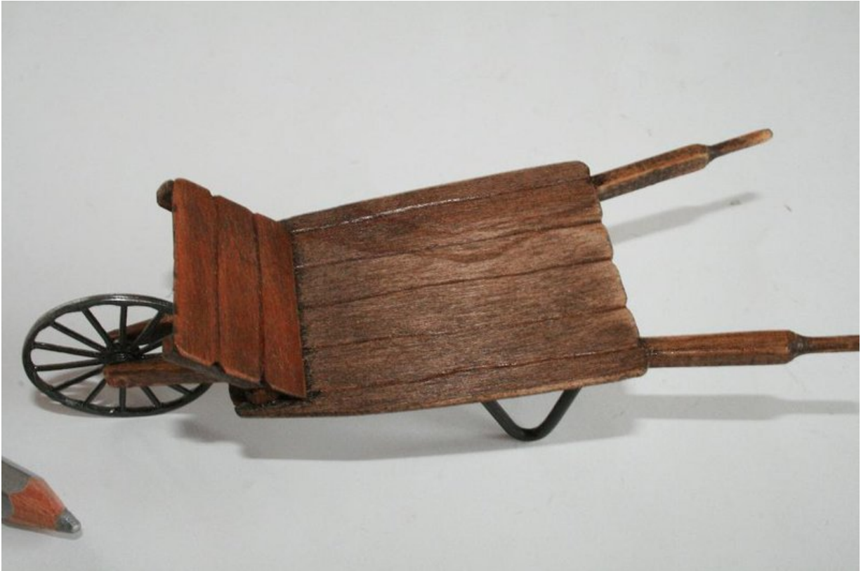
Ancienne brouette à fumier.