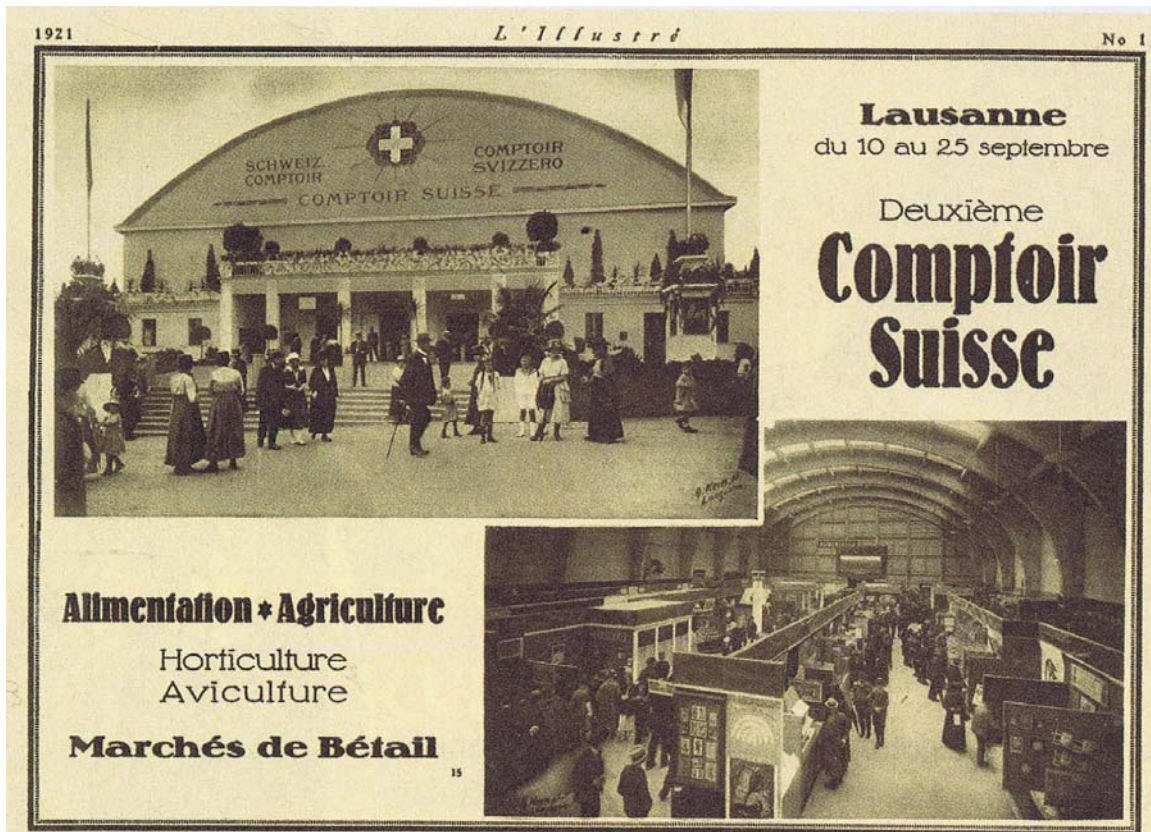
Illustré du 10 septembre 1921.