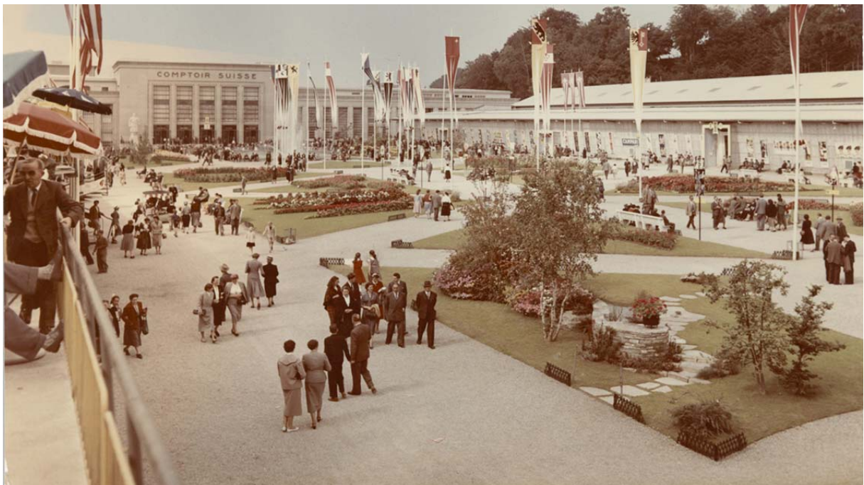
Une ambiance toute particulière dans un cadre magnifique. Nos mères, elles aimaient cela ! La plupart des voyages sur Lausanne se faisaient alors en train. On achetait même d'ailleurs des billets spéciaux-comptoir.