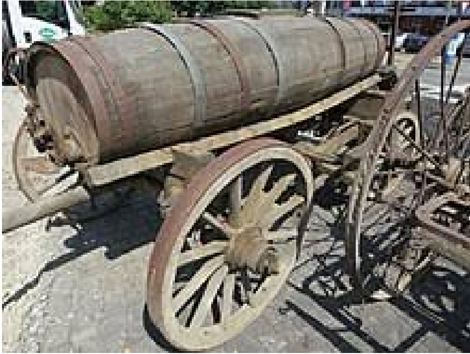
Bossette et char à purin de plaine.