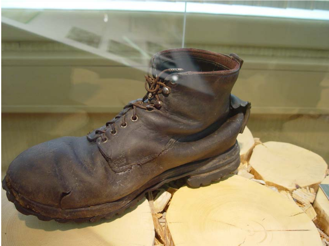
Figuraient aussi en la dite exposition.