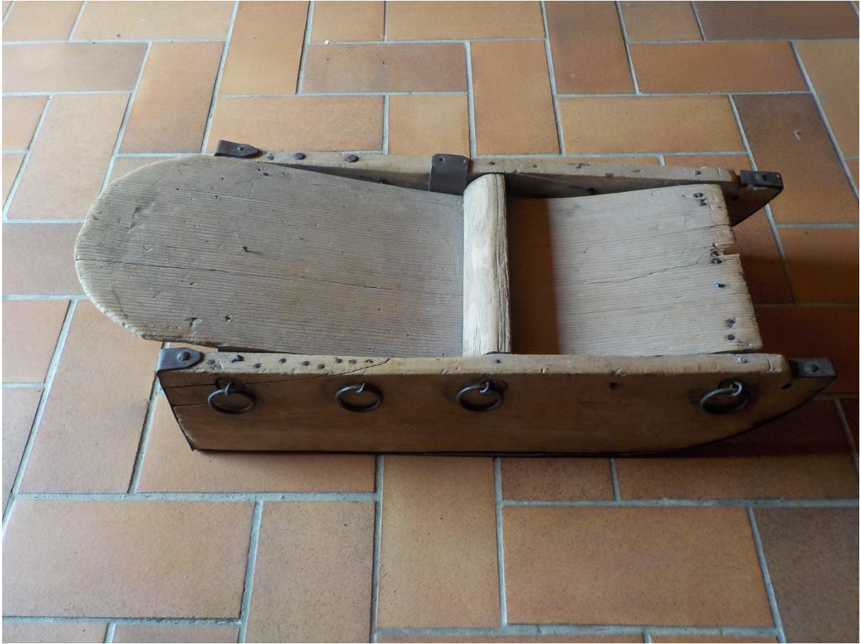
La luge du Patrimoine. Qu'en dites-vous ?