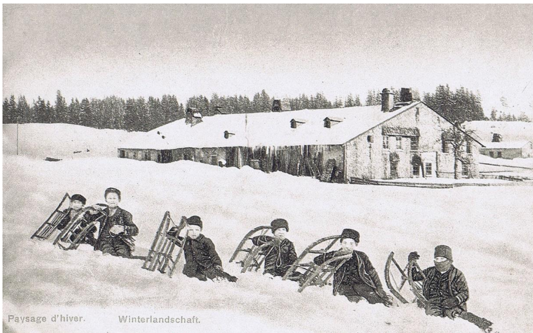
Partie de luges à la Combe du Moussillon. La ferme de l'arrière-plan a disparu dans un sinistre en 1926. Ce voisinage était de 1660.