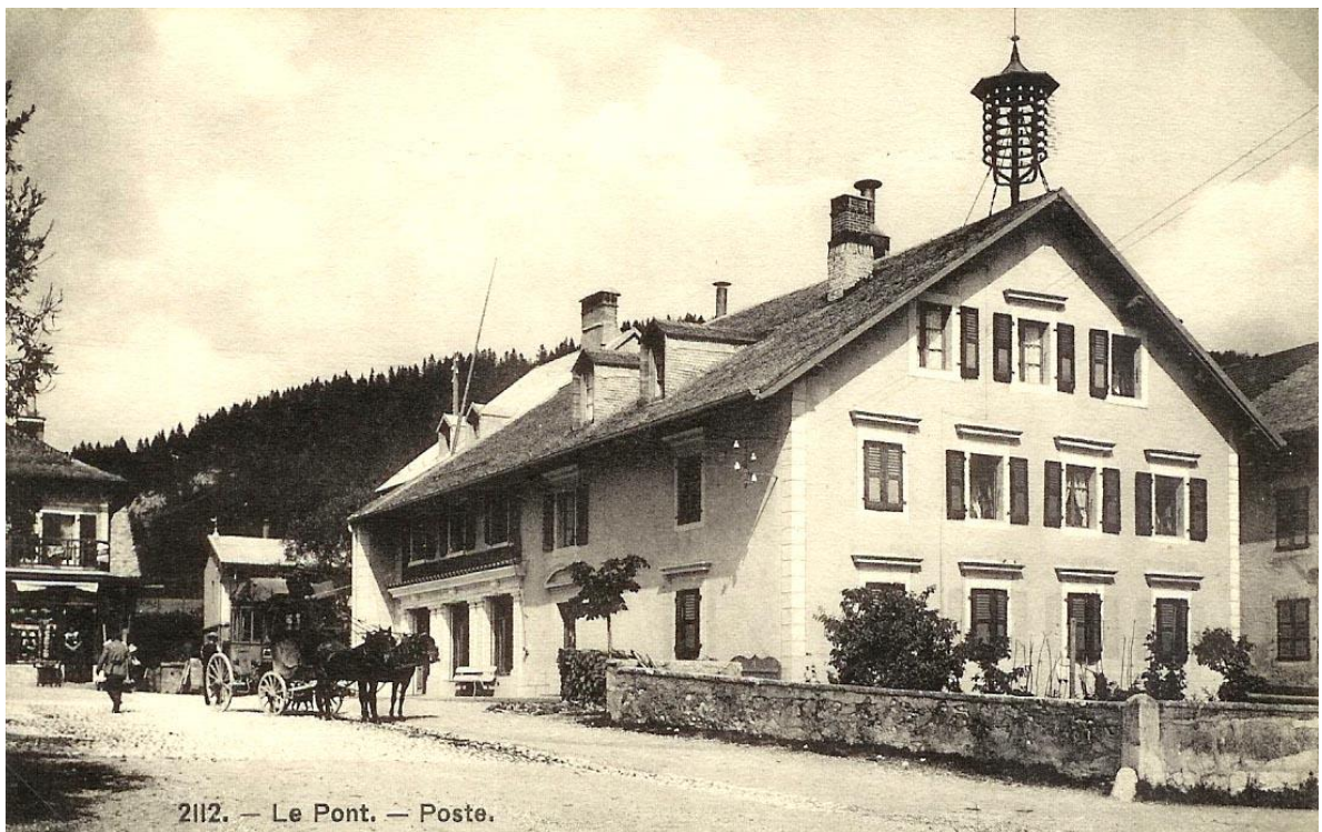
2112. — Le Pont. — Poste.