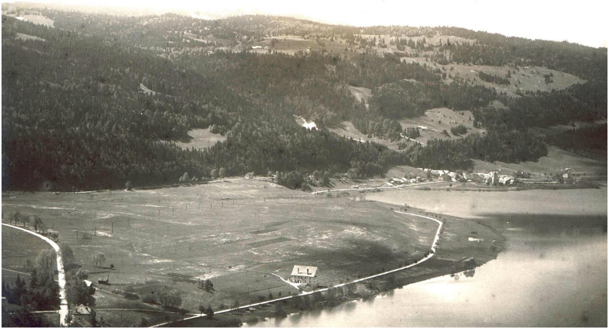
Une ligne de poteaux au moins fait le tour complet de La Vallée.