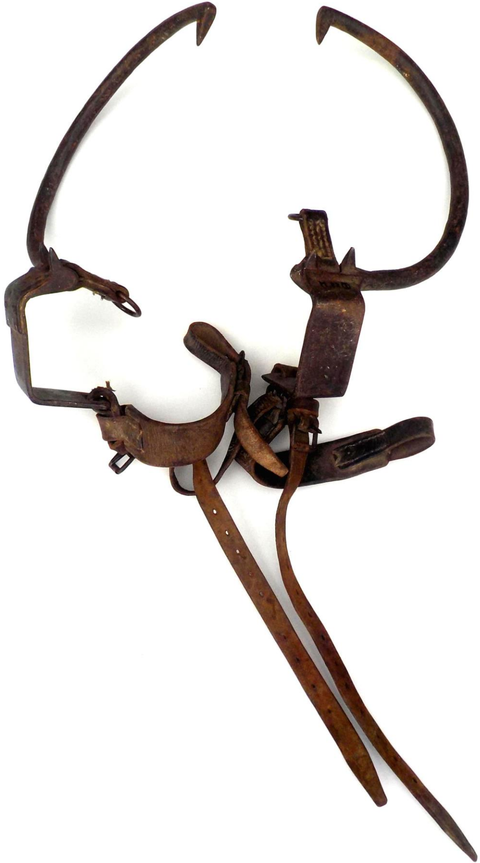
Une paire d'étriers à griffes achetée à la brocante des Mollards en 2022.