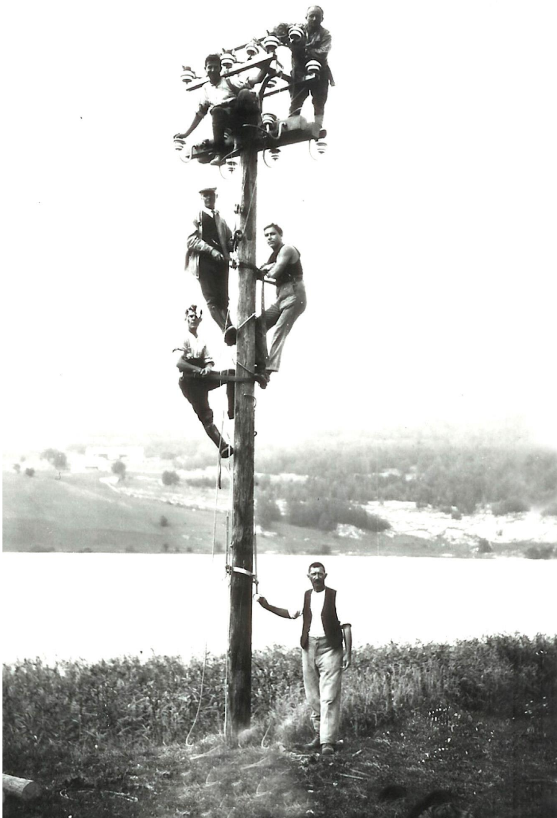
Quand ils s'y mettent à plusieurs !