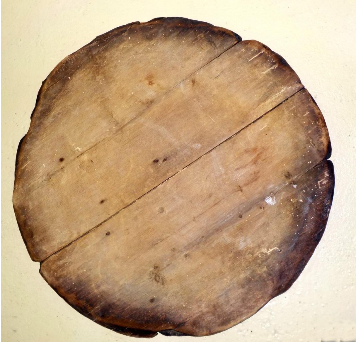
Un rondot ayant servi comme couvercle de chaudière. Il a eu chaud !