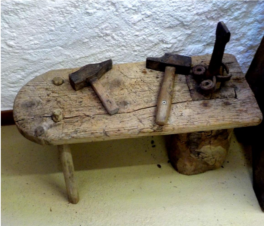
Le banc à enchapler avec les marteaux.