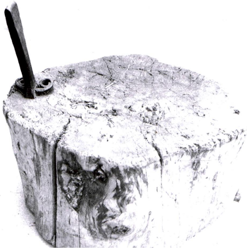
Un simple tronc pour s'asseoir et enchapler.