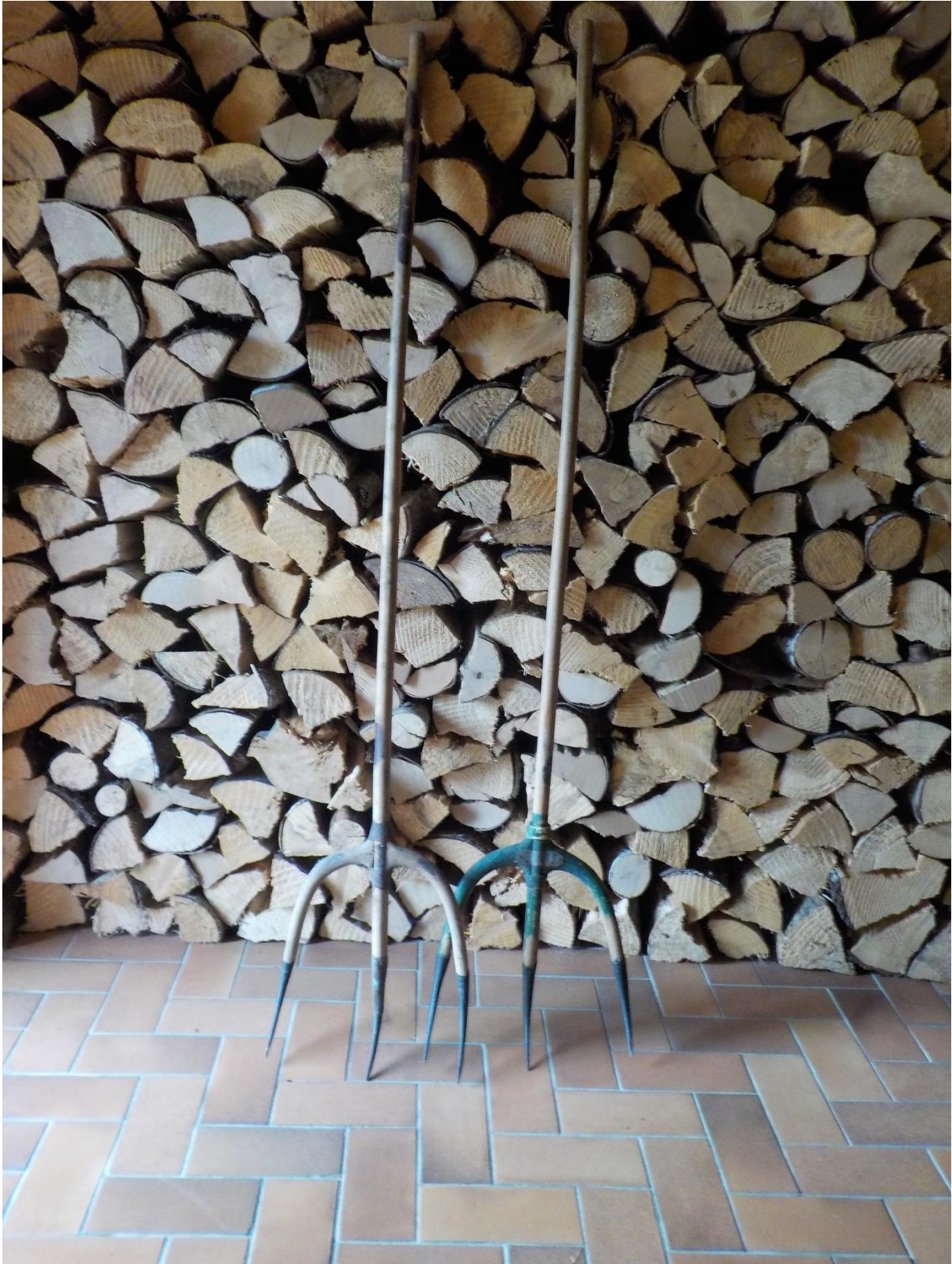
Deux toutes belles pièces.