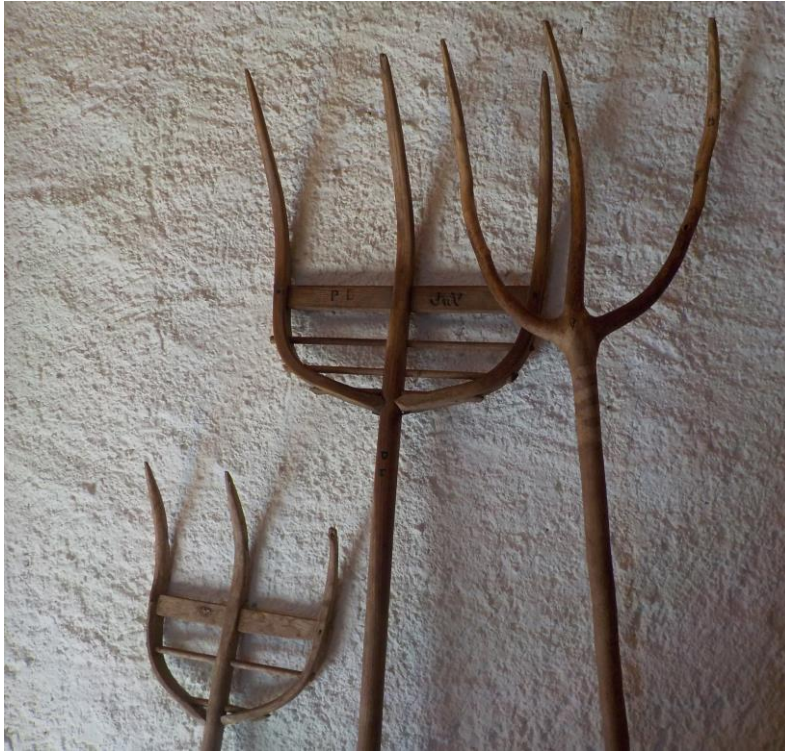
Fourches de bois du Chalottet.