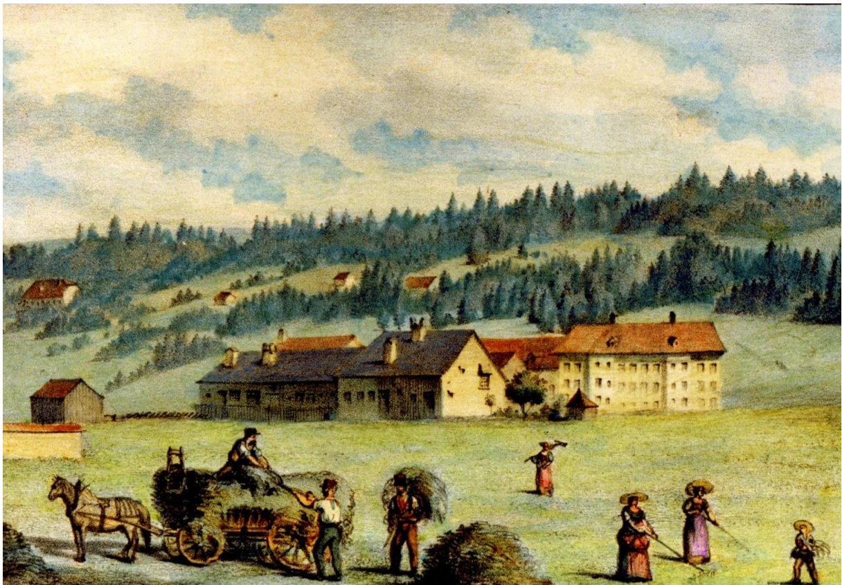
La plus ancienne représentation des foins à la Vallée. Gravure de Devicque, 1852, Chez Villard.