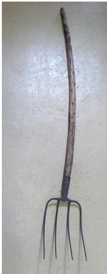
Trident, soit fourche à quatre dents. Pour le fumier et pour le chalet.