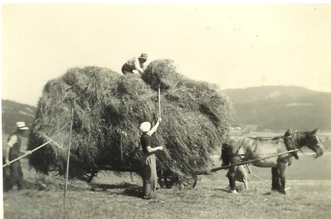
La grande fourche pour charger les chars.