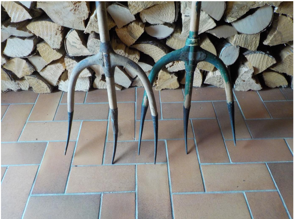
Fourches de la famille de Maurice Meylan avocat à Lausanne, originaire du Séchey d'où proviennent ces deux fourches. Du milieu du XIXe siècle. Fourchons renforcés avec des fers ou des cornes de vaches.