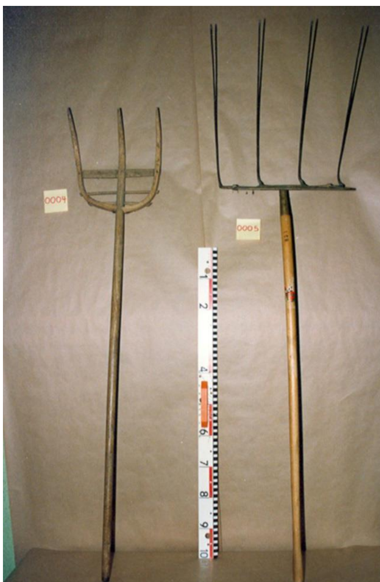
Fourches du Patrimoine. Parmi les premiers objets qui aient été photographiés et inventoriés.

Bref, l'assortiment ne sera jamais complet.