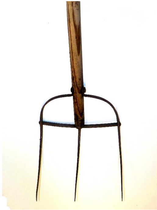
Fourche à trois dents avec renforcement horizontal. Pour le foin.