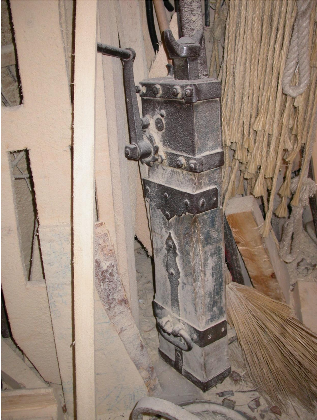
Quand l'on retrouve le cric !