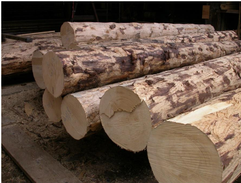
Troncs parés pour le sciage.

Nous ferons donc un tour par l'Abbaye pour retrouver l'ambiance de ces scieries d'autrefois.