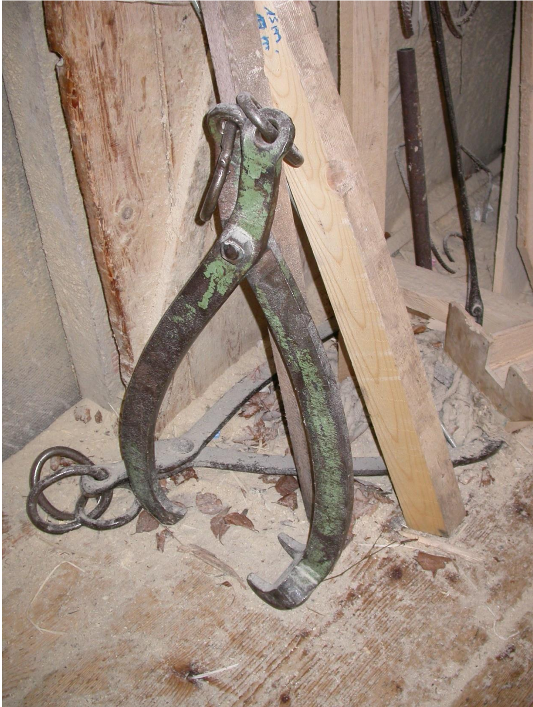
La grande pince. Sur le tout et partout, de la sciure. Comme ça sent bon la sciure dans une scierie !