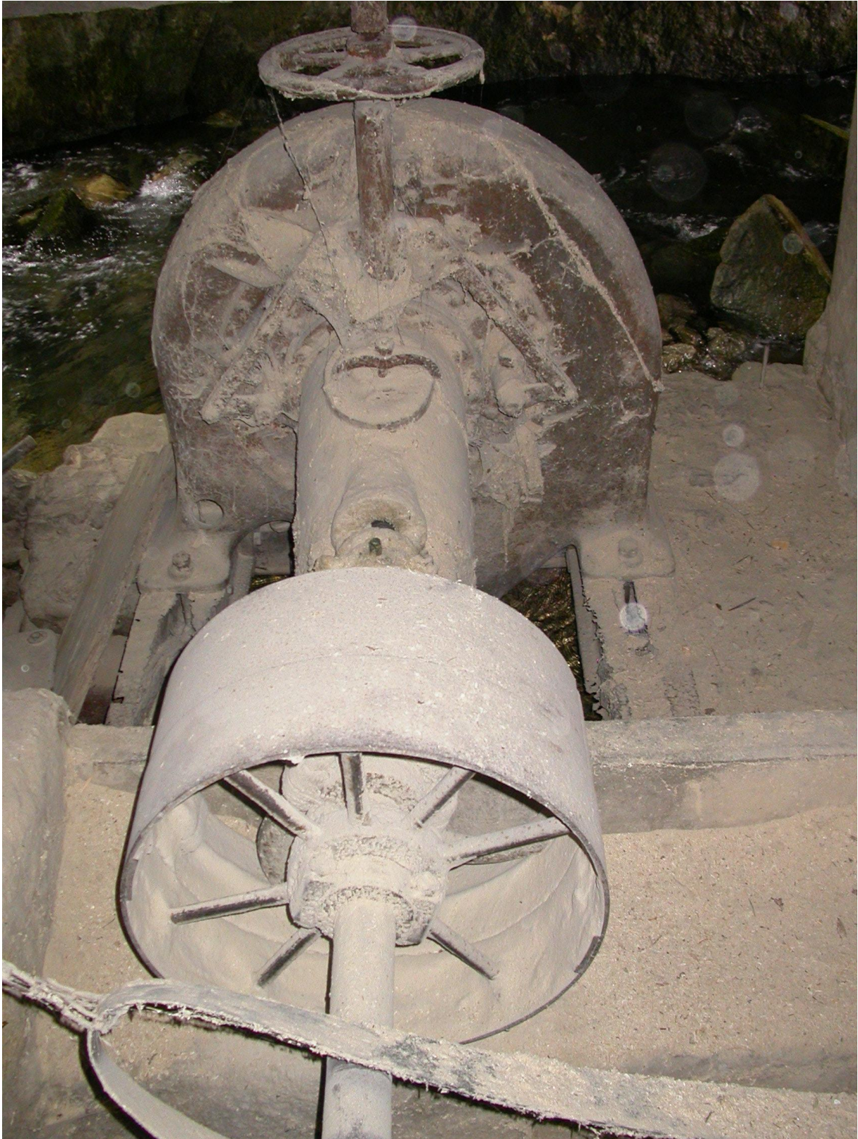
Là où coule à proximité la Lionne et où l'on trouve d'antiques machines et leurs rouages.