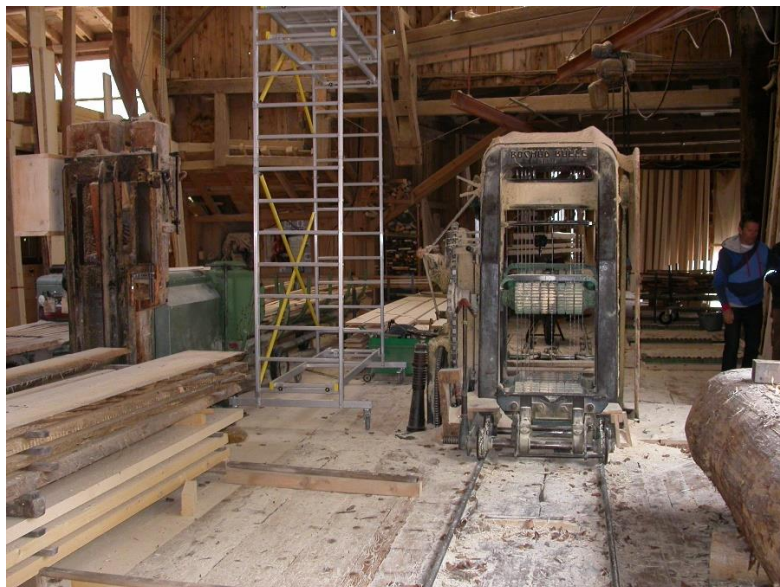
La multiple est prête à entrer en œuvre.