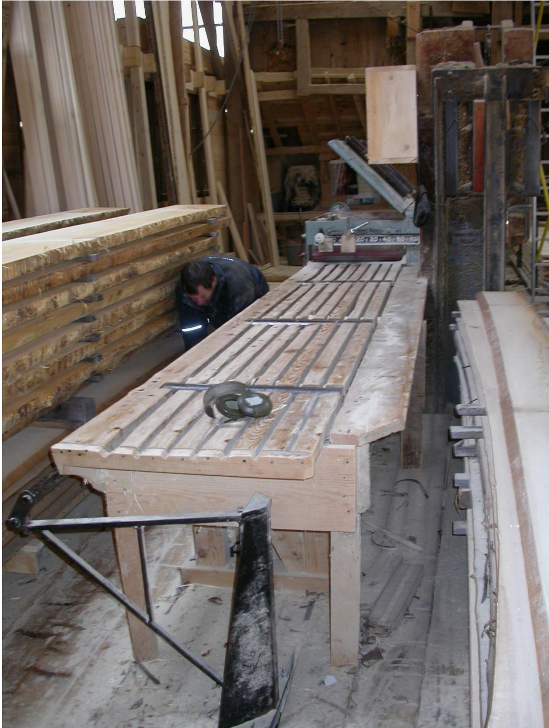
Au bout, la raboteuse.