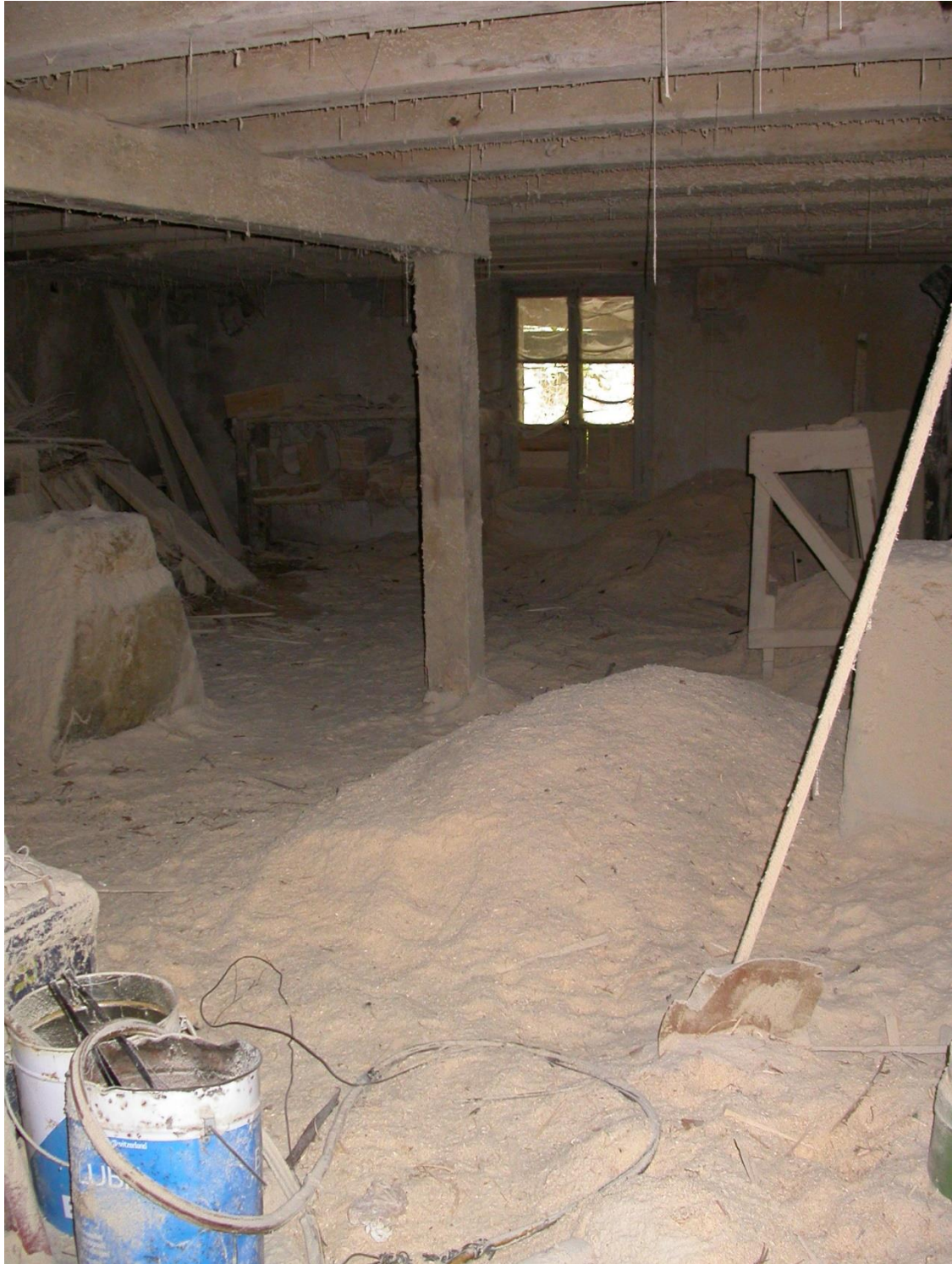
La sciure s'entasse dans les tréfonds de la scierie.