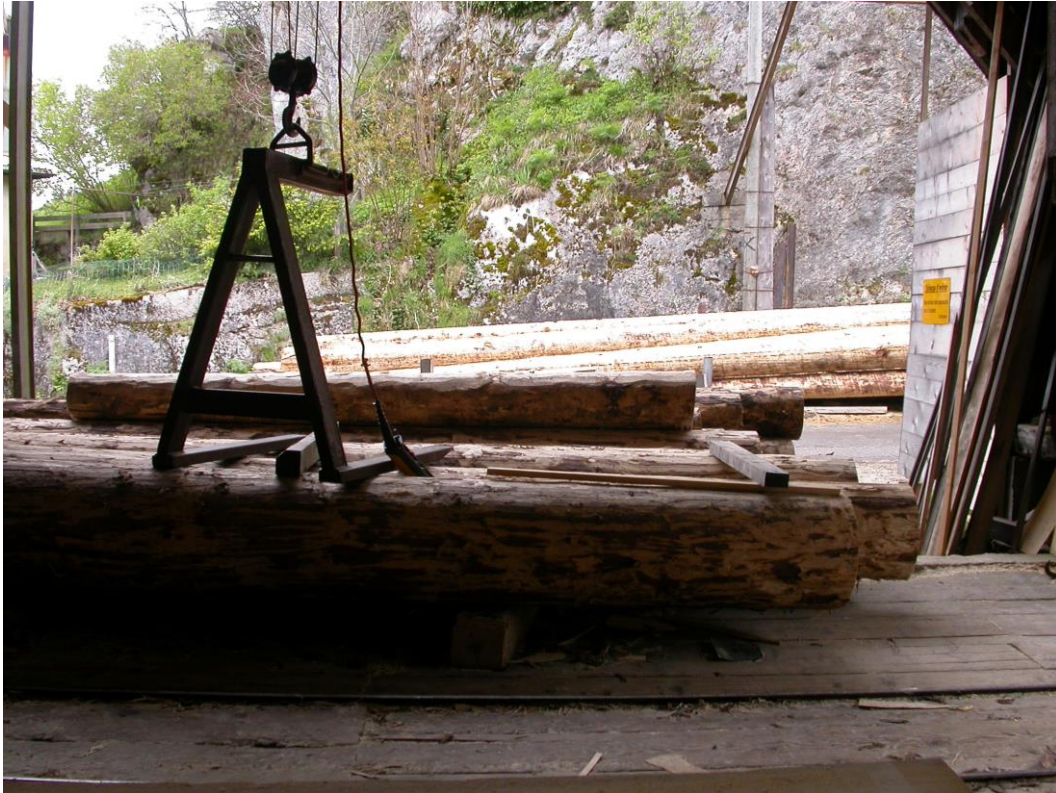
Treuil et élément de transpalette.