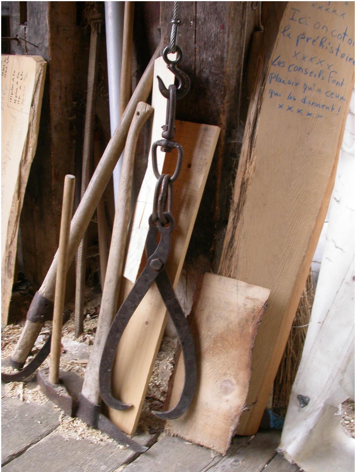
Les outils du scieur, le tourne-plot, la masse, le scherpi, la grande pince.