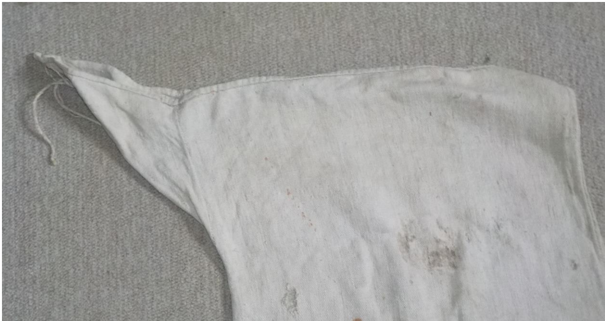
Le système de fermeture dans le haut du sac.