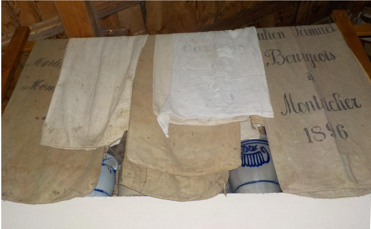
Une jolie collection de sac à grain.