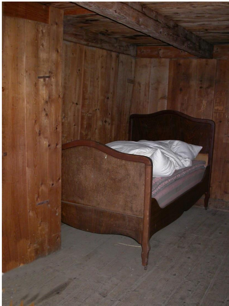
Lit à l'ancienne dans un chalet.

Au début du XVII e siècle apparaissent les lits à alcôve. Le lit placé dans cette sorte de chapelle est séparé du reste de la chambre par une balustrade. Ses côtés forment ruelle. C'est là que le ou la propriétaire reçoit les amis, devise des choses du jour, discute avec les poètes. Comme le montre la chambre de Henri IV au Louvre, cet usage remontait à la fin du XVI e siècle.