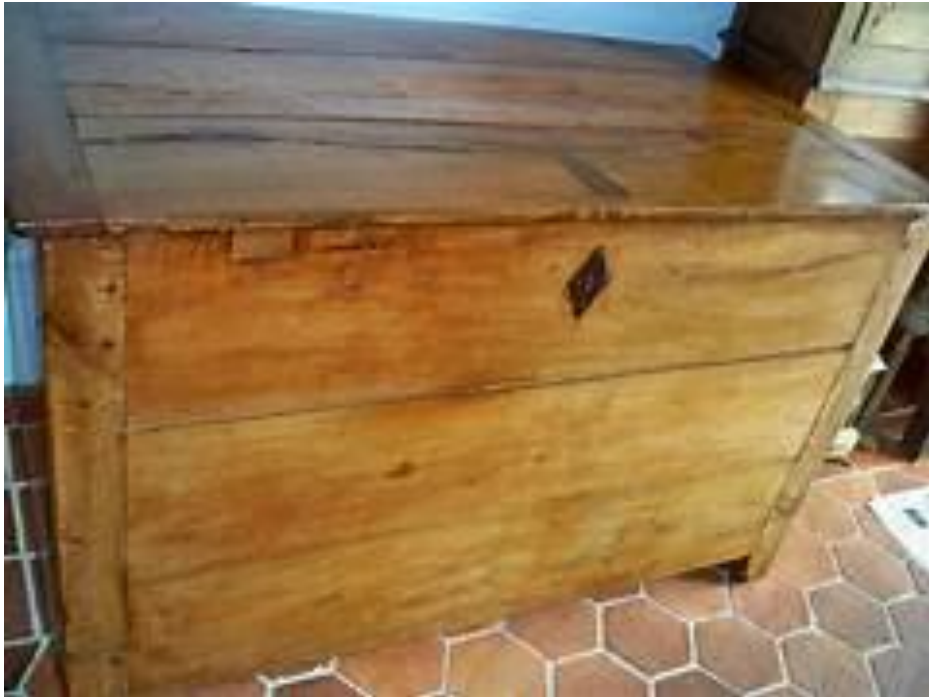
Avant la commode, le coffre, où l'on pouvait ranger draps et couvertures.

Autre exemple, toujours pour le XVIIIe siècle. Cette armoire en sapin, de grande qualité, a été fabriquée aux Bioux.