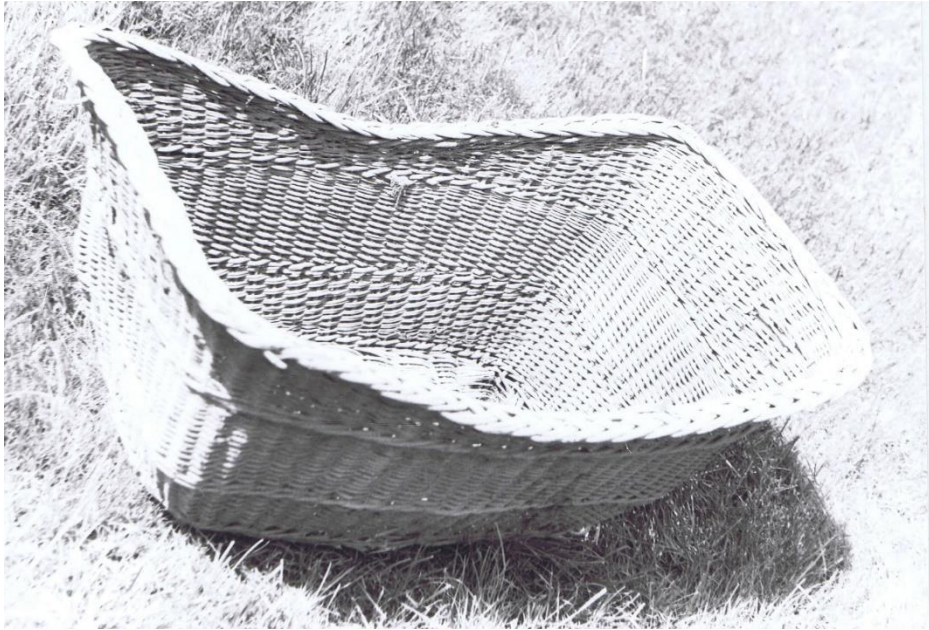
Moïse de chez Titouillon, détruit pour cause de détérioration avancée par les cirons.