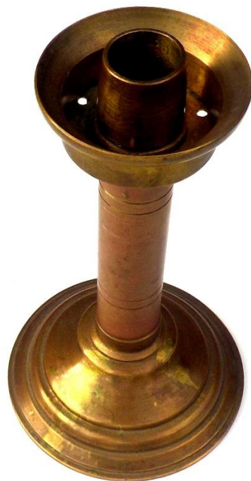
La lampe à huile au début, la bougie après peut-être, avec le porte-bougies, et enfin le lampadaire ou plafonnier dès l'arrivée de l'électricité à la Vallée en 1903.