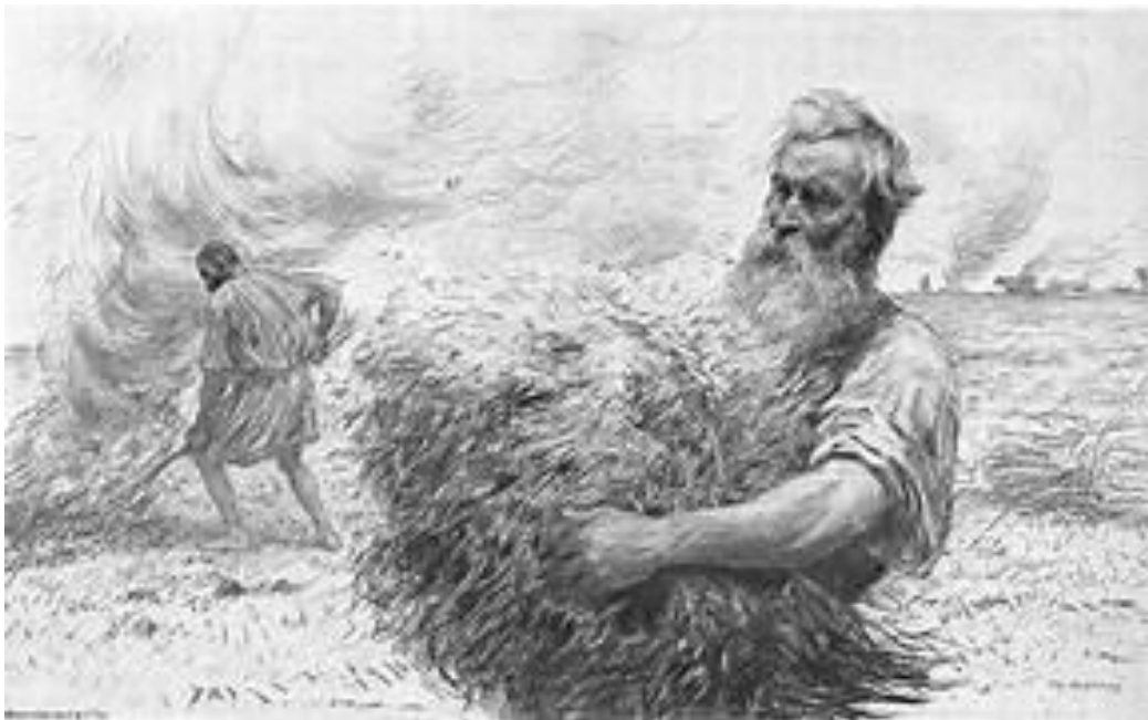
Au mur des encadrements de litho de Burnand comme le Semeur et le brûleur de fenasse, ou des scènes religieuses, avec un grand Jésus-Christ conducteur spirituel de tout un peuple.