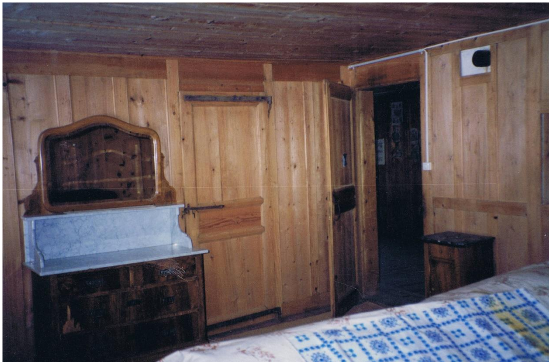
Ancienne chambre à coucher d'une maison combière.