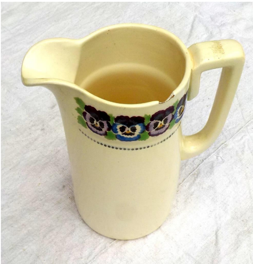
Encore un pot pour l'eau.