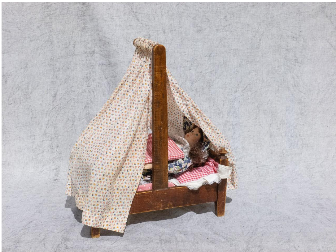
Autre petit lit de poupée du même.