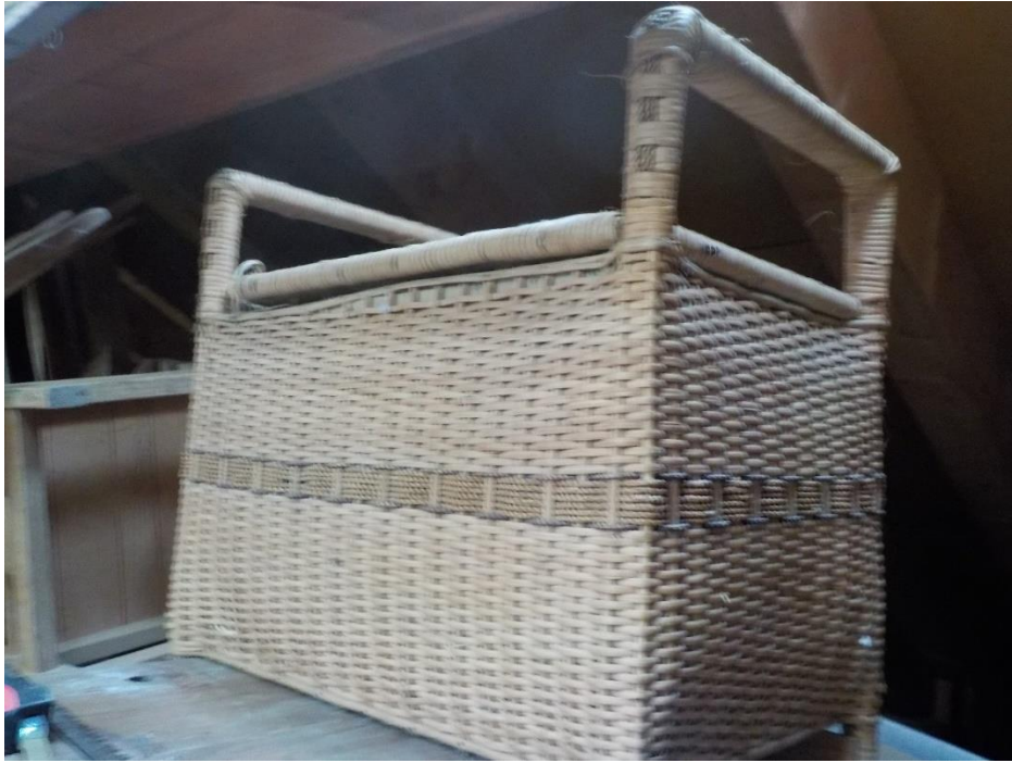
Un pouf parfois - le terme reste à discuter - pour mettre les habits sales.