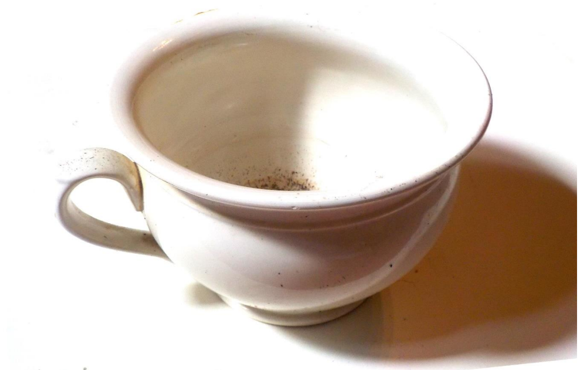
Sous le lit, ce bon vieux pot de chambre.