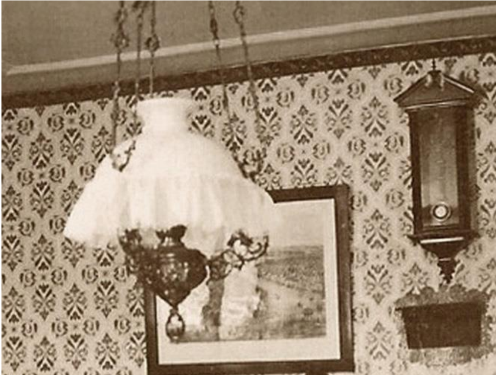
Lampadaire ou plafonnier de la maison Le Coultre à la Golisse vers 1900.