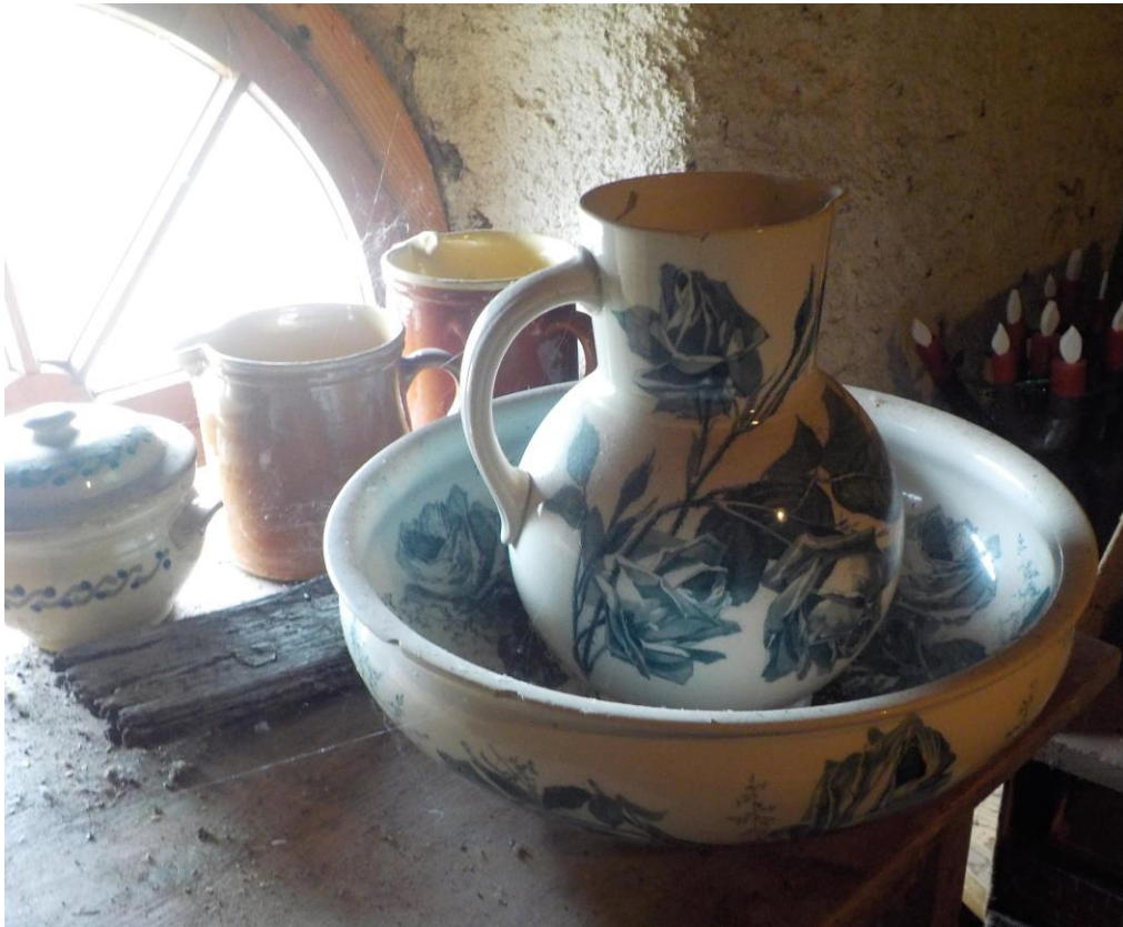
Pot et cuvette.