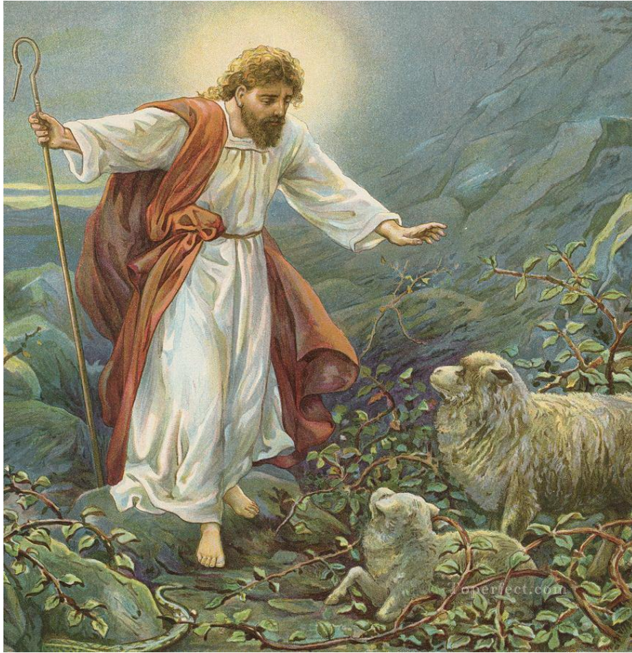
Du genre, quoique encore plus vieillot.