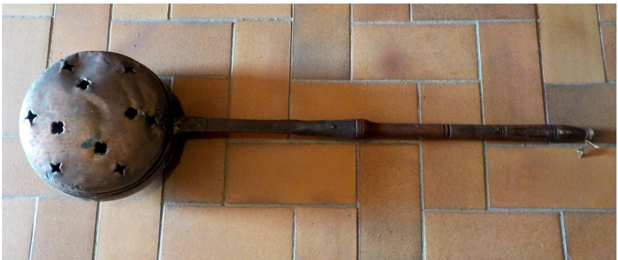
Ou avec le moine ou chauffe-lit.