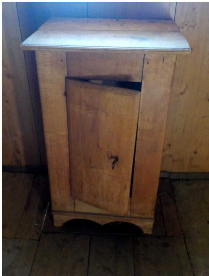
Table de nuit rustique. Deux par chambre.