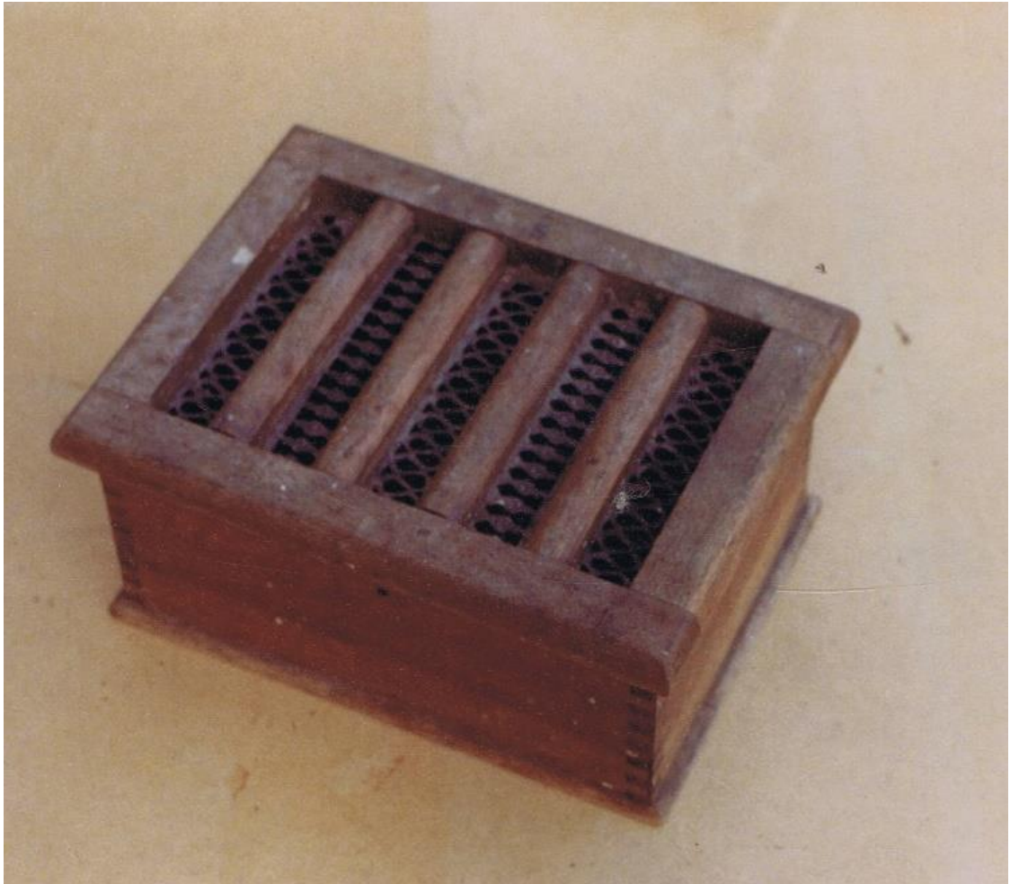
L'hiver, il fallait bien chauffer le lit. A la chaufferette. Comme ici.