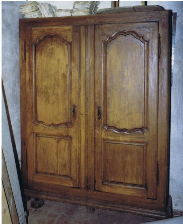
L'armoire double de mariage. XVIIIe siècle.

La bouillotte, quasi universelle. On pouvait aussi utiliser des noyaux de cerise dans un sachet, le tout bien chaud.