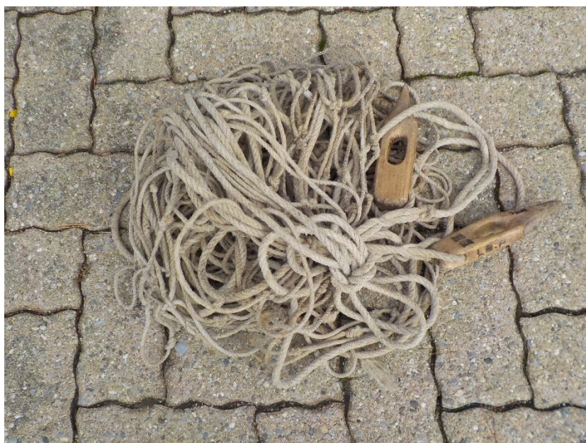
Filet à foin en provenance du Bas-du-Chenit de même, de Claude Jaccoud.