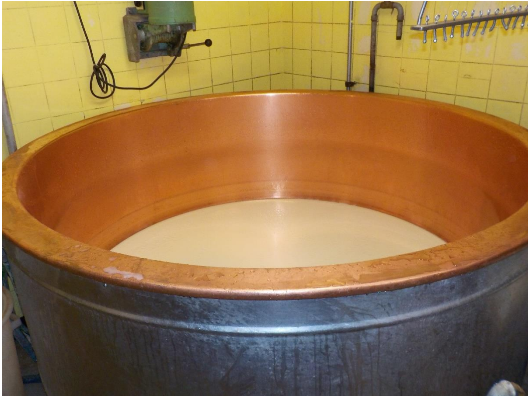
Le lait repose encore dans la chaudière.