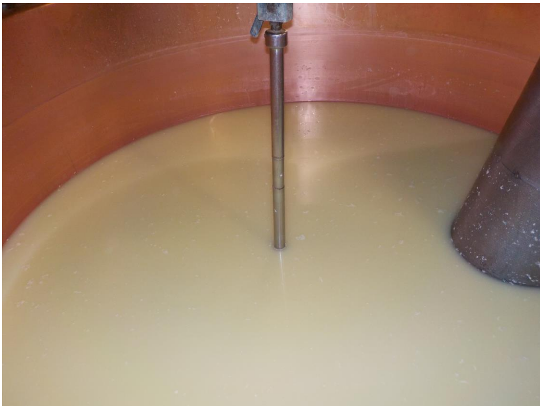
Plus tard, après les opérations traditionnelles, le lait a caillé.