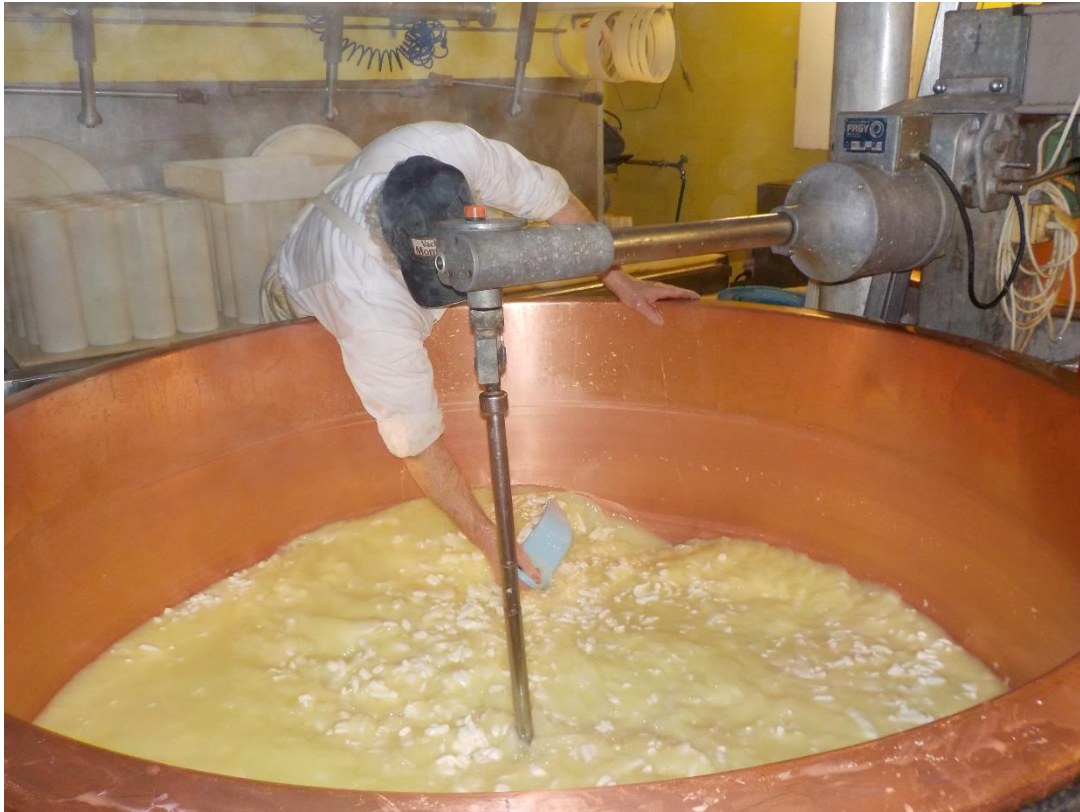
Le travail du caillé et le contrôle de son état.