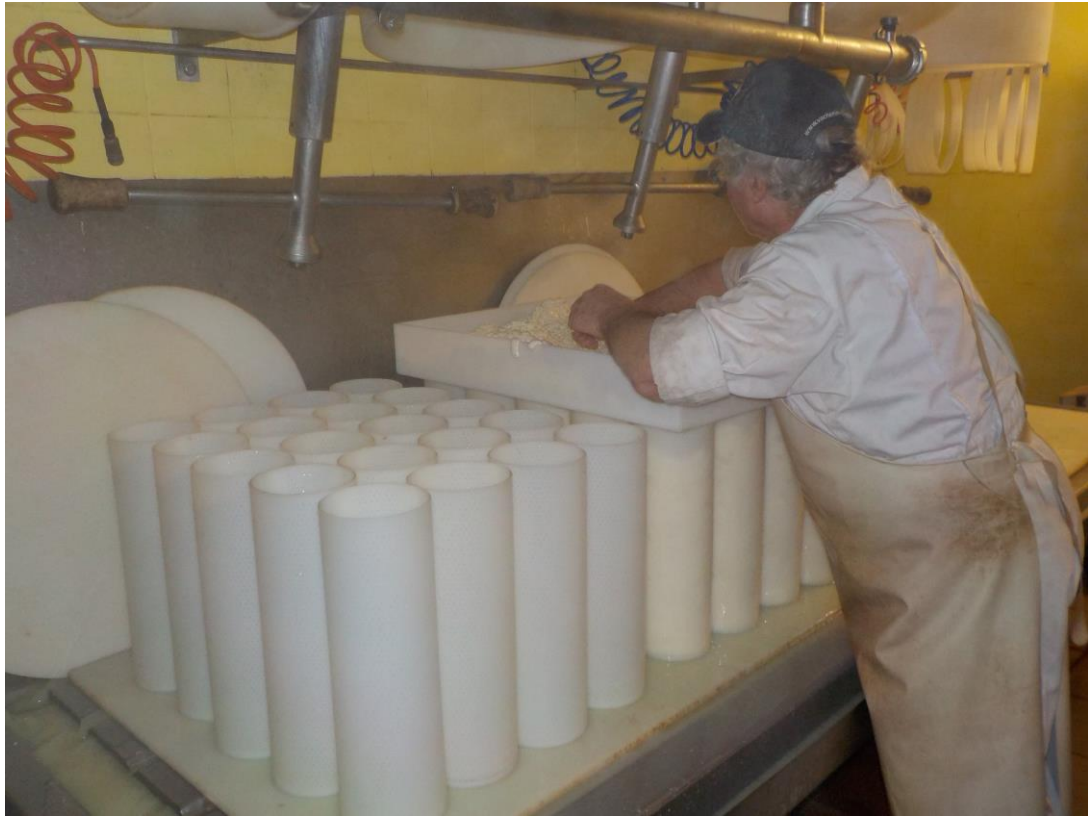
Moules et multimoule.