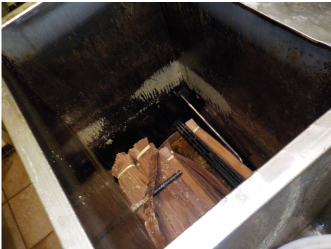
Les sangles ont été mises à tremper dans un bac.