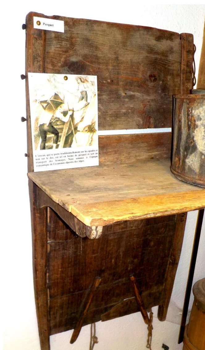
L'authentique perquet de Mallevaux-Dessus.

Le perquet ne figure pas non plus dans le dictionnaire du patois vaudois. Il se montre donc bien discret ! On en a réparé plusieurs, bretelles y comprises. Ils méritent toute l'attention du conservateur.