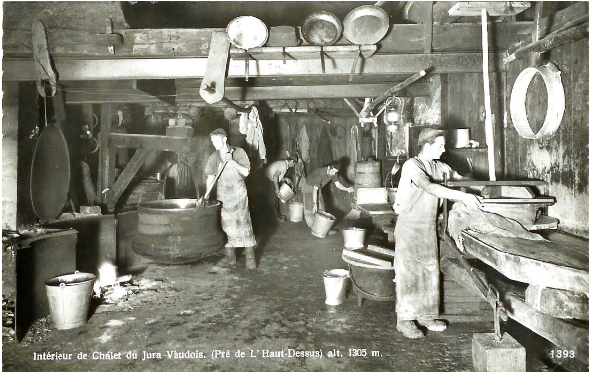
Intérieur de Chalet du Jura Vaudois. (Pré de L' Haut-Dessus) alt. 1305 m.