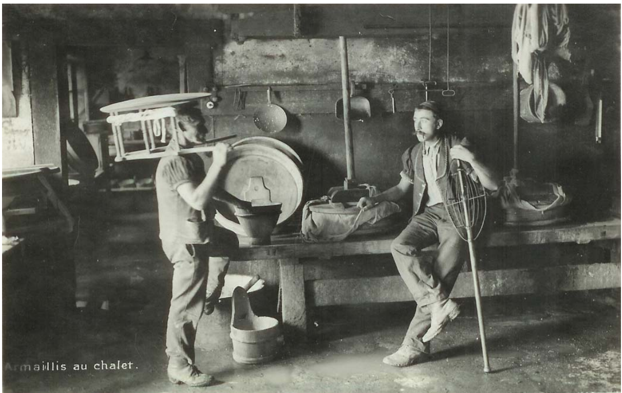
Armaillis au chalet.