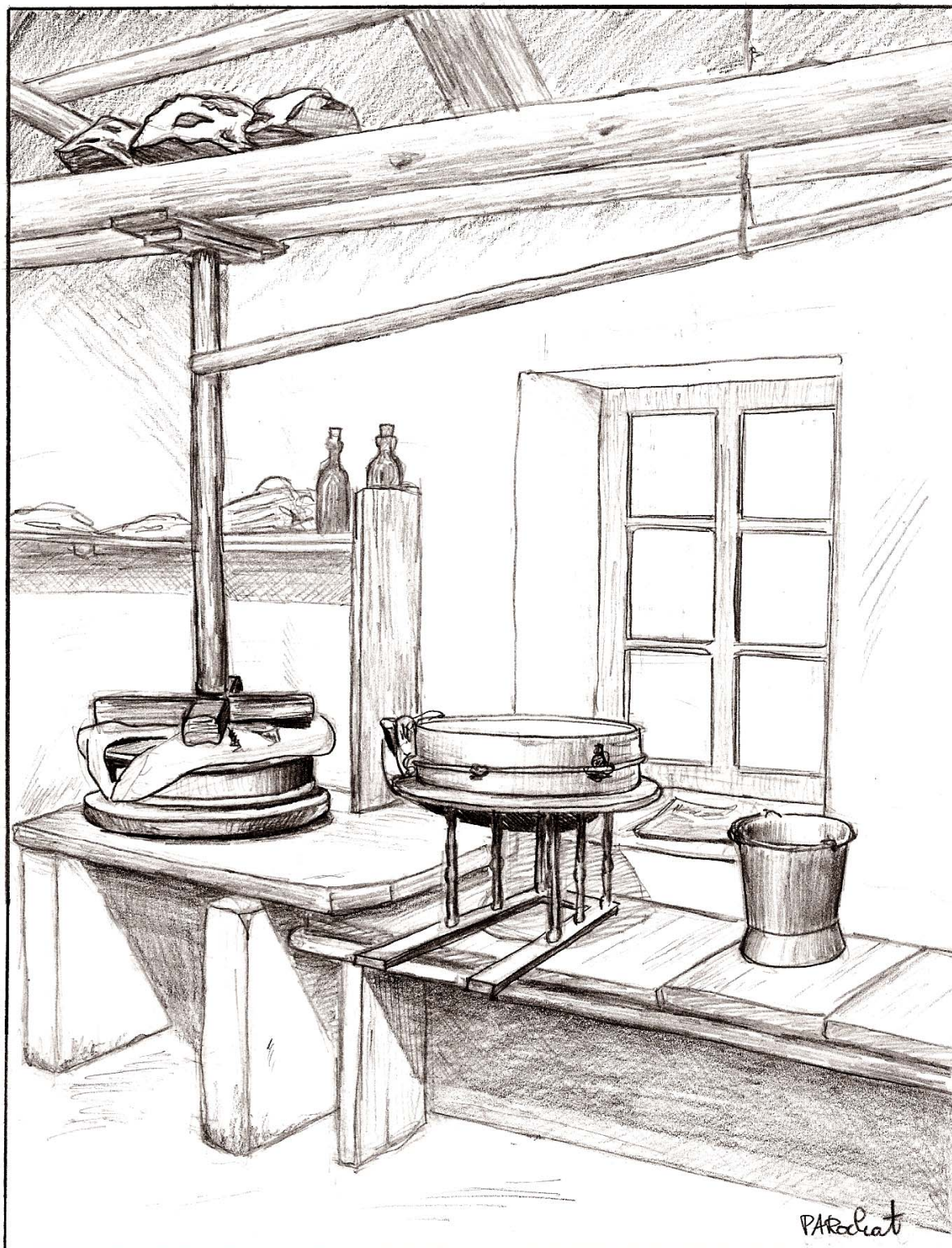
Une presse, l'oiseau, le cercle à fromage.