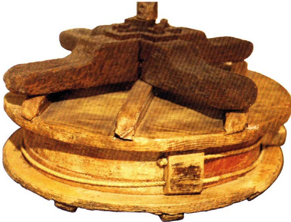
Photographie 43. Moule utilisé pour le pressage des grains de caillé.

Dessus les deux rondots et le fromage pris en sandwich avec son cercle entre ces deux éléments, le croisillon.