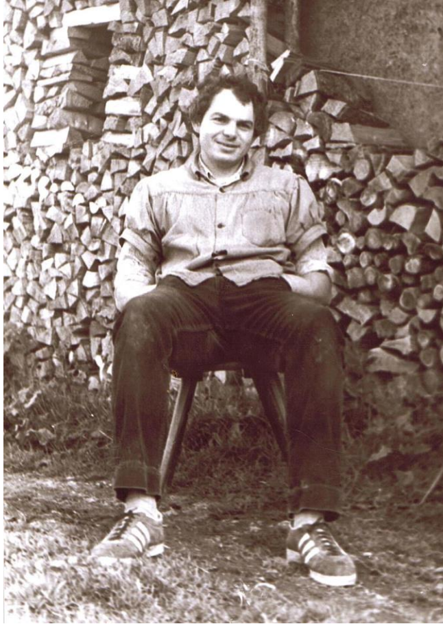
La chaise à Arthur est vraiment confortable...