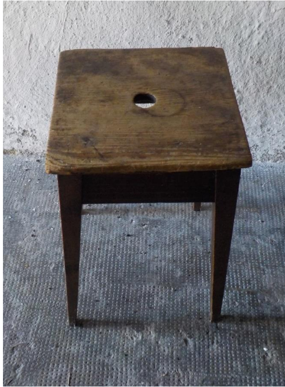
Un seul tabouret. Il serait injuste de le mettre de côté !