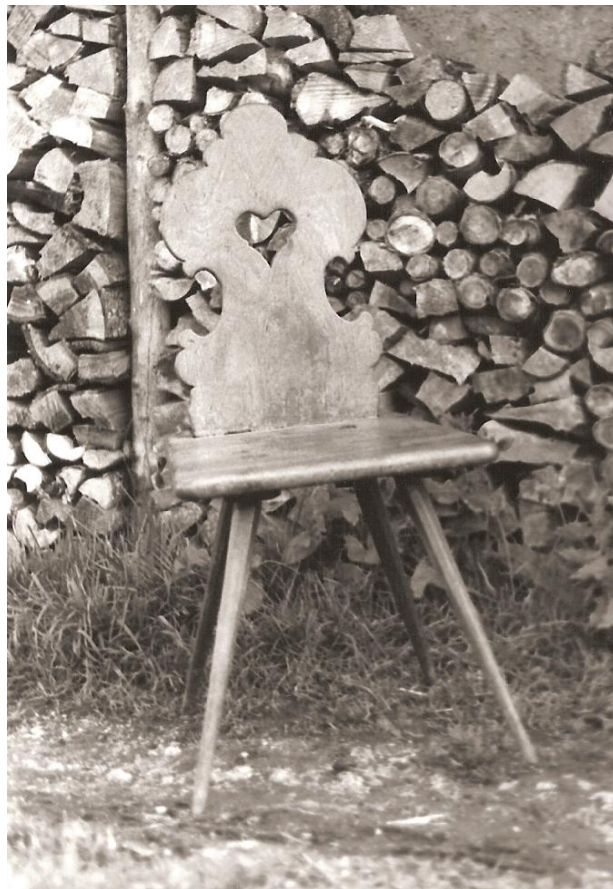
La chaise d'Arthur... en bois dur... faite sur mesure... résiste à l'usure...