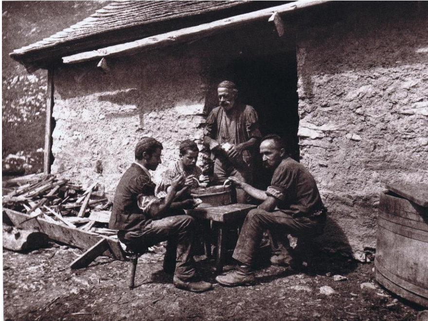
Le banc minable à gauche, sera-t-il condamné pour le feu ? Nous sommes en Gruyère.

On allait l'oublier, les berges, dans le temps, alors que pour une fois ils s'étaient décidés à manger dehors, ils s'installaient directement sur leur botte-cul.