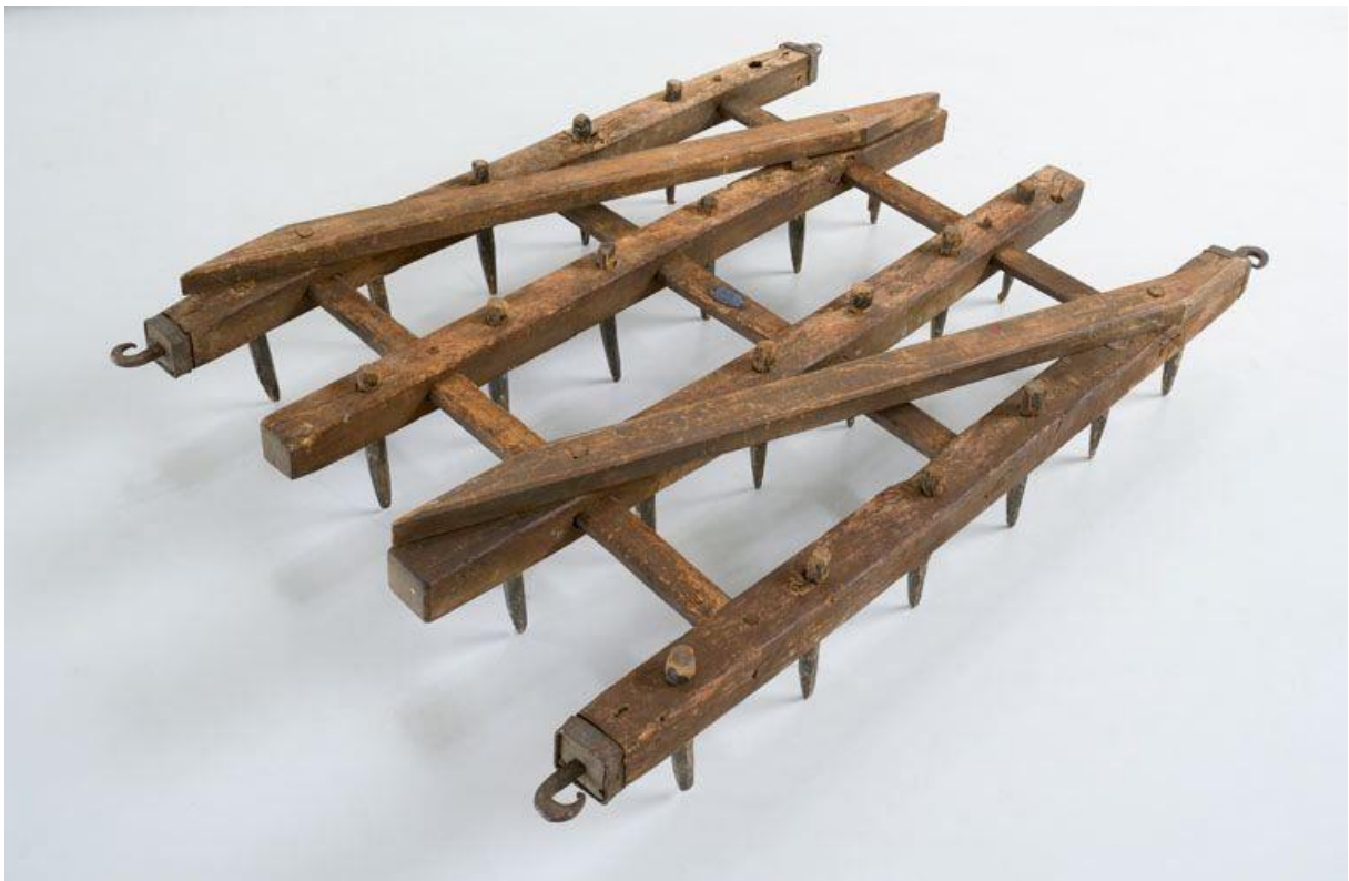
Herse ancienne