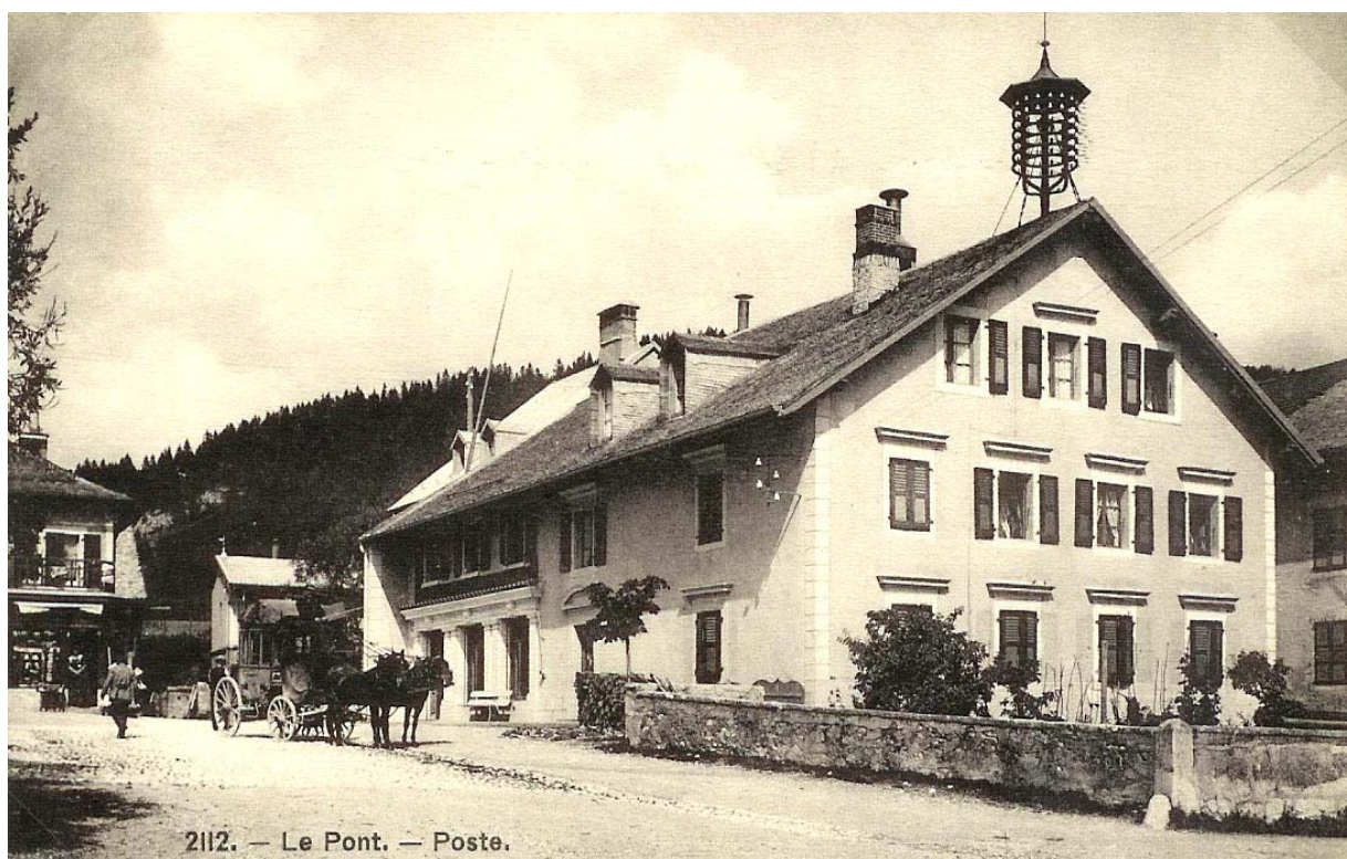
C'est dans ce bâtiment que cela se passe, derrière les trois fenêtres situées au-dessus des locaux de la poste. Il n'est toutefois pas certain qu'un dentiste soit déjà là à cette époque ! A gauche, le kiosque par contre est ouvert.