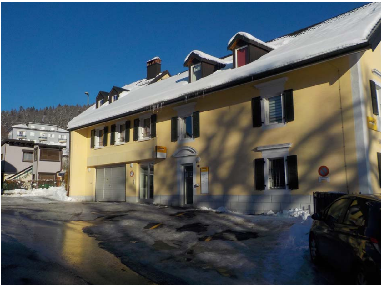
Bâtiment de la Poste. Voyez les trois fenêtres du deuxième étage à gauche. Les deux premières correspondent à la salle d'attente, la troisième au cabinet lui-même.

Et puis maintenant, à chacun de revisiter ses souvenirs. Et de nous apporter des photos. S'il en existe.