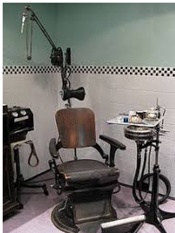
C'est à peu près cela...