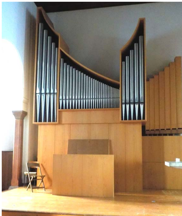
Les orgues de l'église du Lieu.