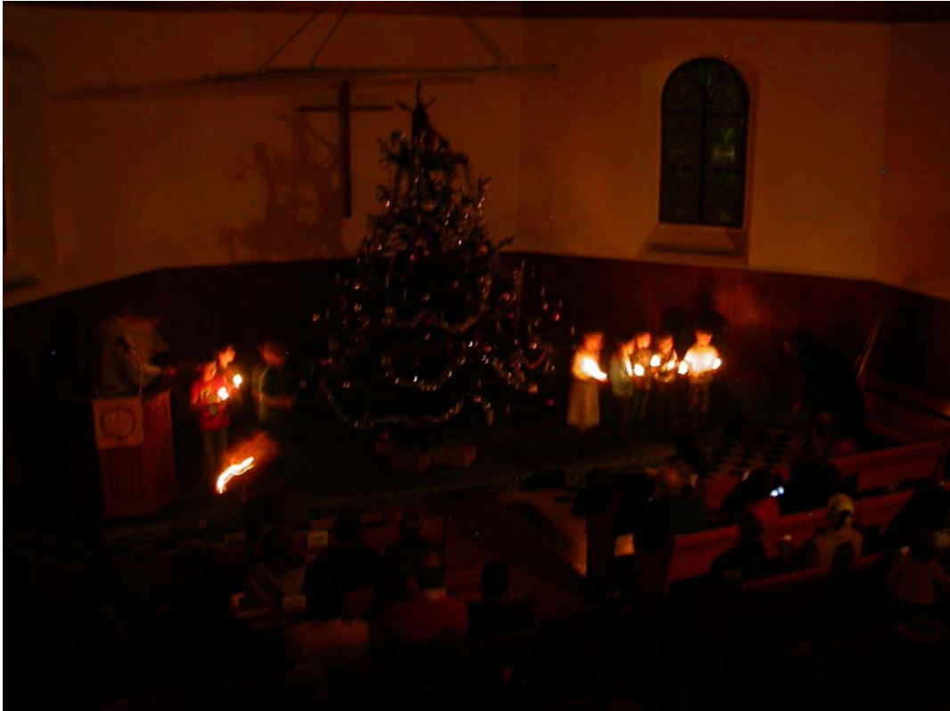
Un Noël en 2010