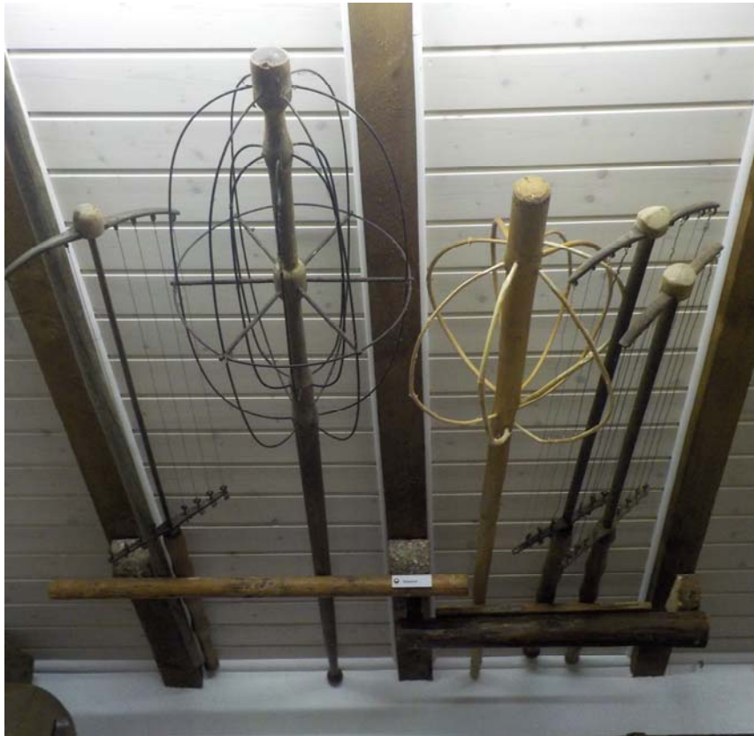
Collection privée de tranche-caillé et de débattoirs sur lesquels on reviendra au chapitre suivant.