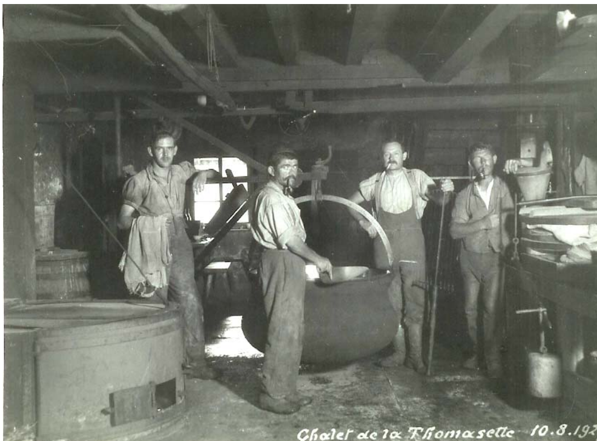
De même une simulation. Le personnage en bretelle, deuxième depuis la droite, tient un tranche-caillé dans la main gauche.