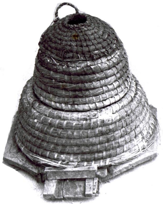
La ruche complète, en paille.