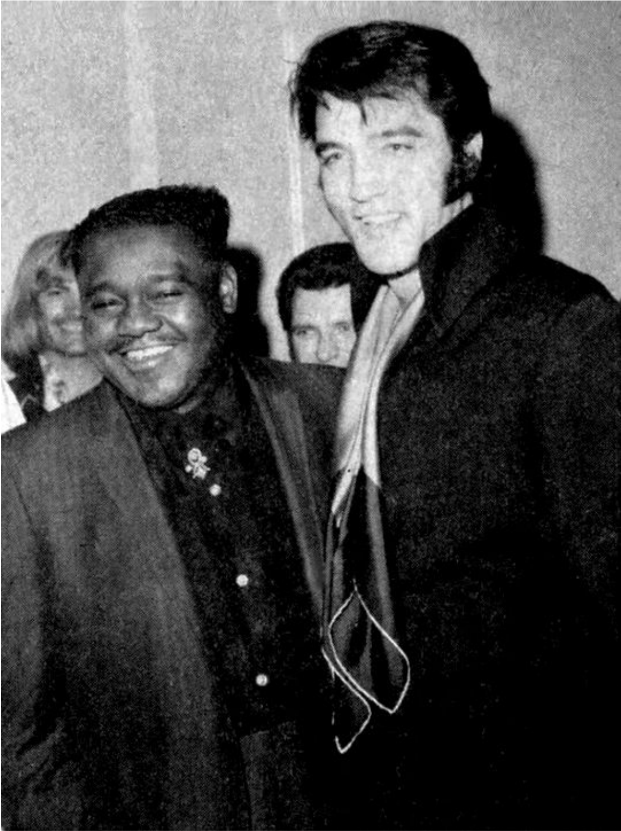
Avec le King, soit Elvis Presley.