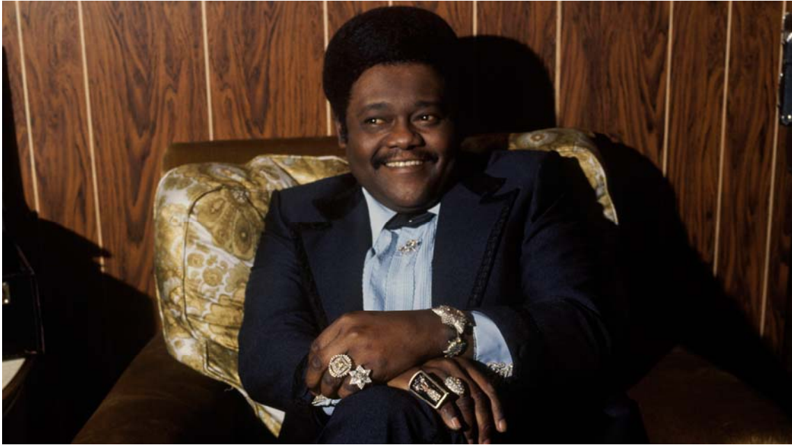
Des bagouzes plein les mains, sa marque de fabrique.