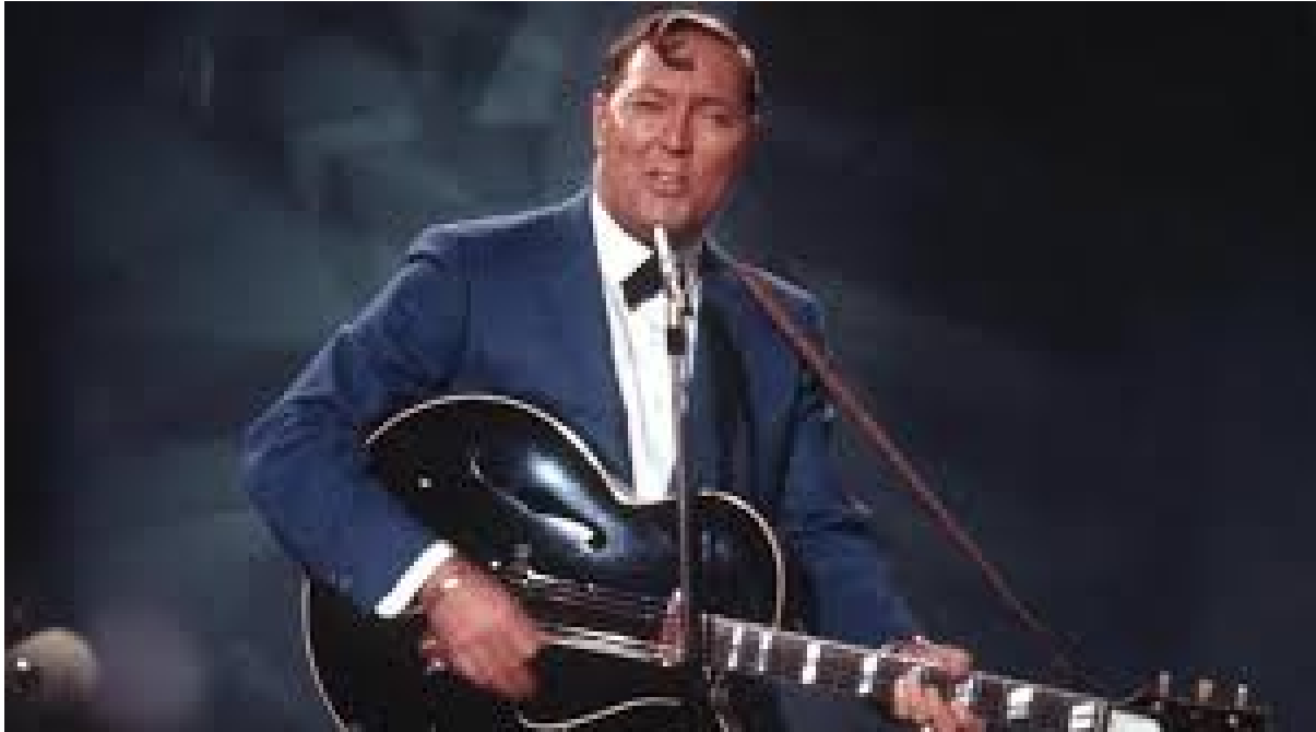
Bill Haley et ses Comets. Né en 1925, c'est déjà presque un « vieux » quand il lance Rock around the clock en 1954, le premier véritable rock.