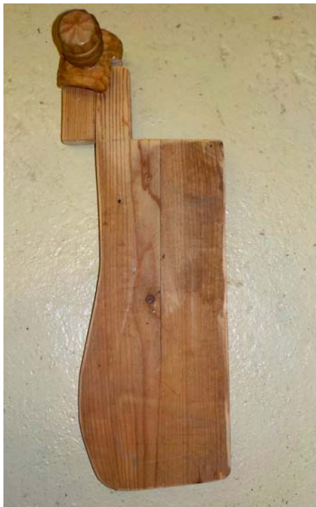
Un arrêt-fromage de notre fabrication.

Cette pièce de bois, jamais vue ni dans un chalet ni ailleurs, ne figure en conséquence pas dans nos collections. En bricoleur ordinaire que nous sommes, il ne nous restera plus qu'à la fabriquer selon les informations données ci-dessus.