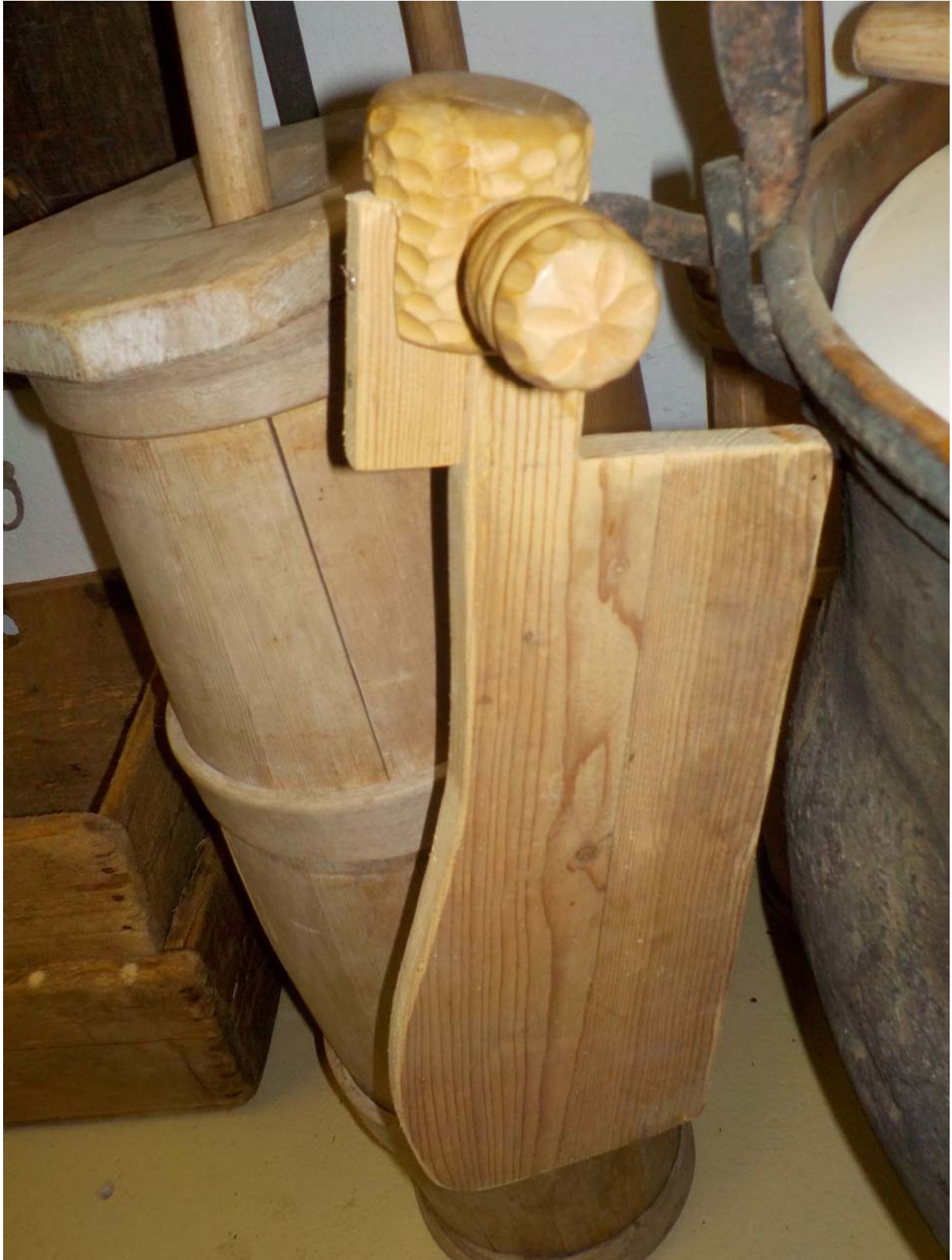
Idem, avec une attache faite d'un casse-noix en bois ! Il est évident que le tout se fixe à l'intérieur de la chaudière et non à l'extérieur comme ici.