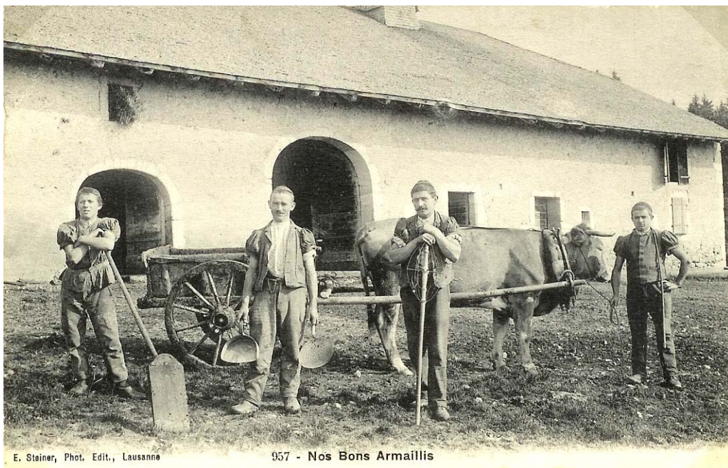
L'une des rares photos d'extérieur où un armailli vous présente des poches, l'une pour le caillé l'autre pour le séré.