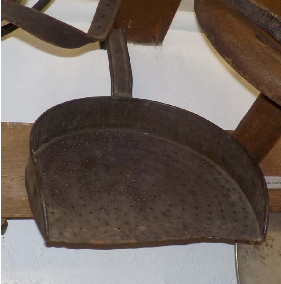
Celle-ci, tout en n'étant qu'en fer blanc, pouvait servir à la fabrication du séré.