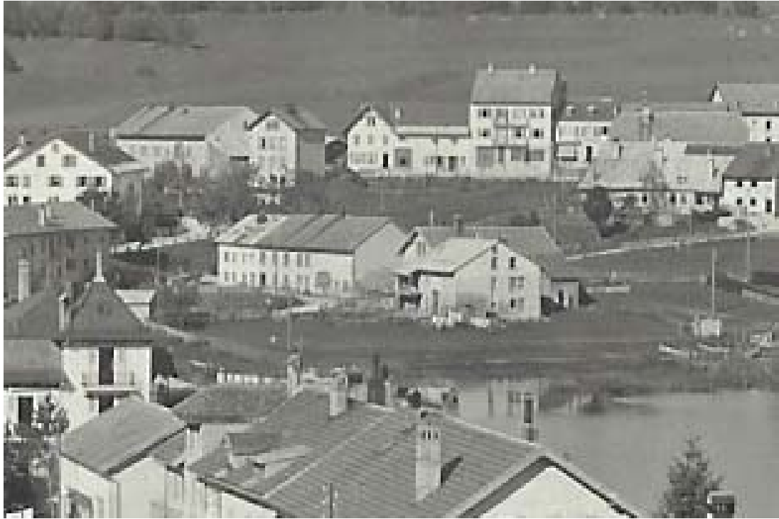
Au centre, Là-Dessous vers 1925. Les Albertano sont installés dans le voisinage, partie de gauche, la partie de droite étant la maison Pisome.