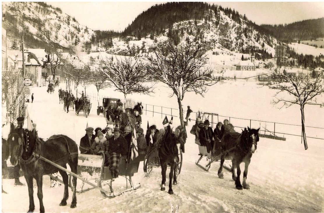
Au Pont, photo Joseph Locatelli.