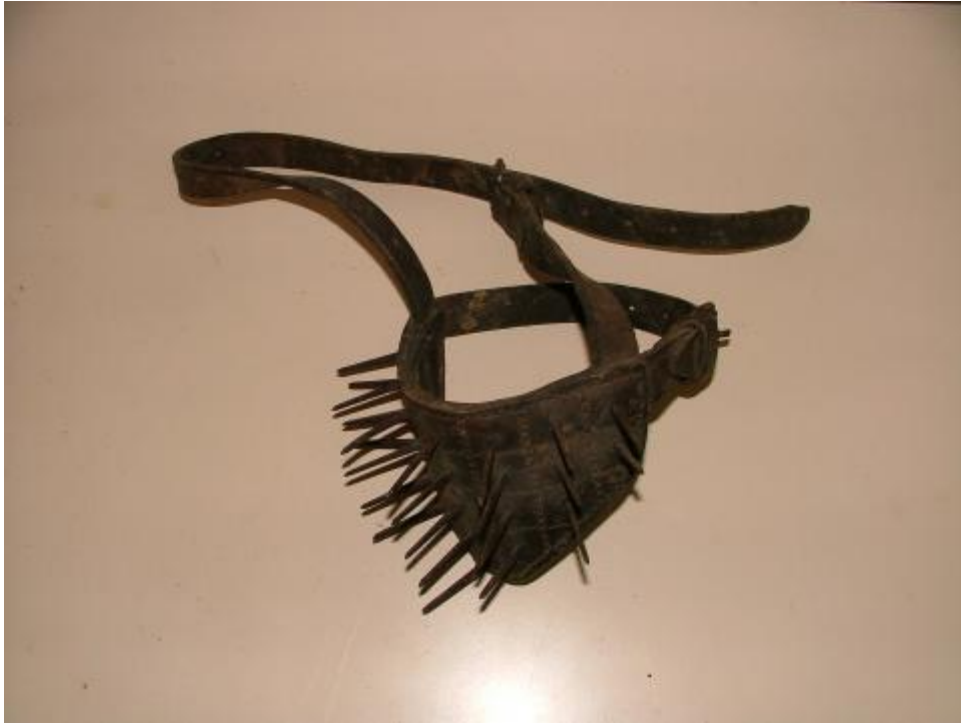
Muselière de sevrage à veau.