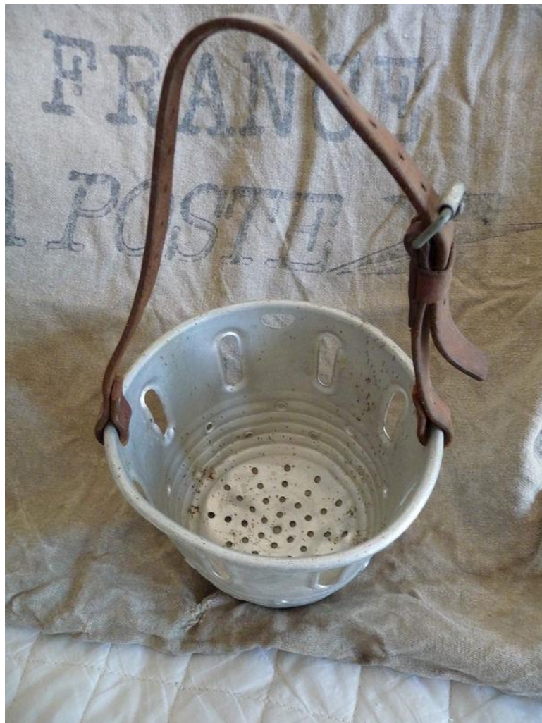
Muselière à veau.