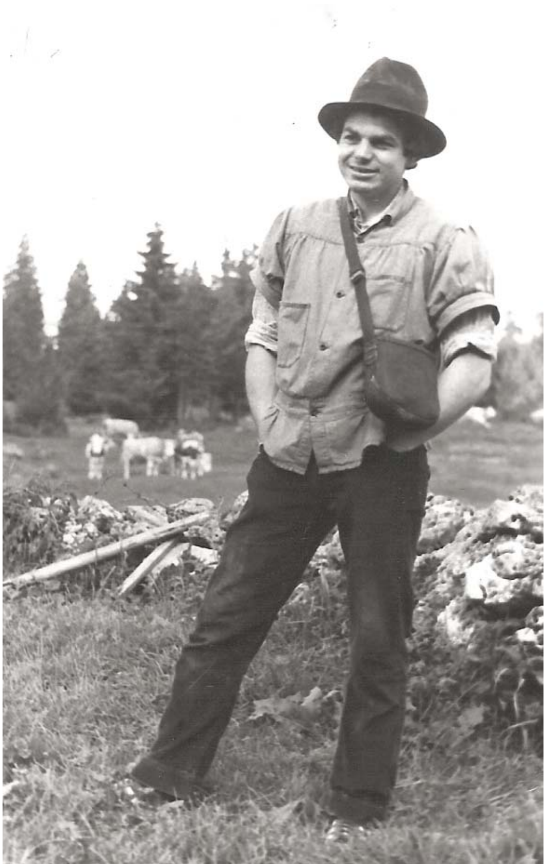
Son fils, qui n'a rien du berger, pour une fois se met en scène !