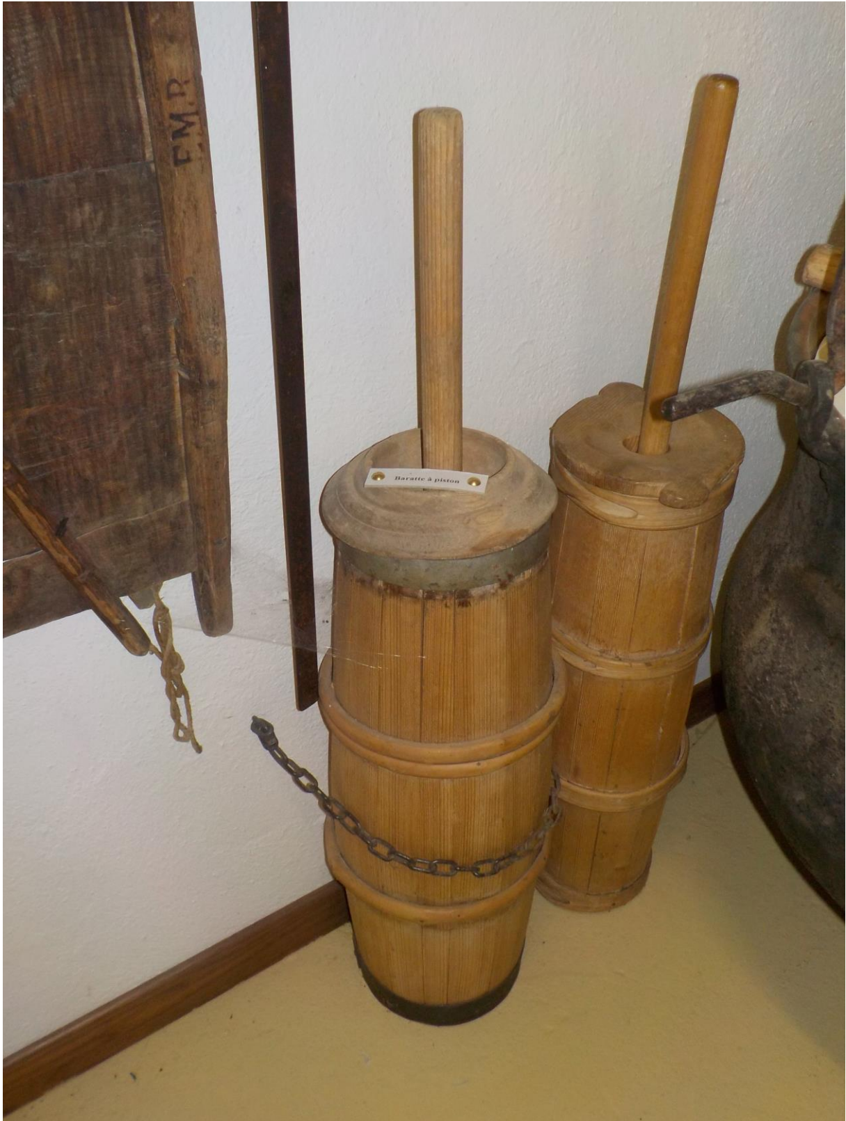
La baguette est à gauche de la baratte à piston.