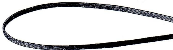
Photographie 52. Baguette d'acier flexible.

Pour sortir les grains de caillé de la chaudière, le fromager utilise une baguette autour de laquelle il enroule un des côtés d'une toile carrée ou rectangulaire préalablement trempée dans le petit lait. Si le fromager est seul, il noue deux coins de la toile autour de son cou. Tenant la baguette des deux mains par ses extrémités, il la plonge dans la chaudière en suivant lentement et du mieux possible les parois et le fond de la chaudière, en partant du côté opposé où il se trouve pour terminer du côté où il est positionné.