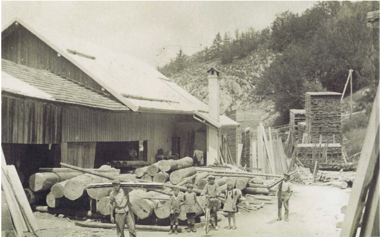
Les charretiers avaient déposé leurs plots dans la proximité même des scieries, ici à celle du Moulin à l'Abbaye.