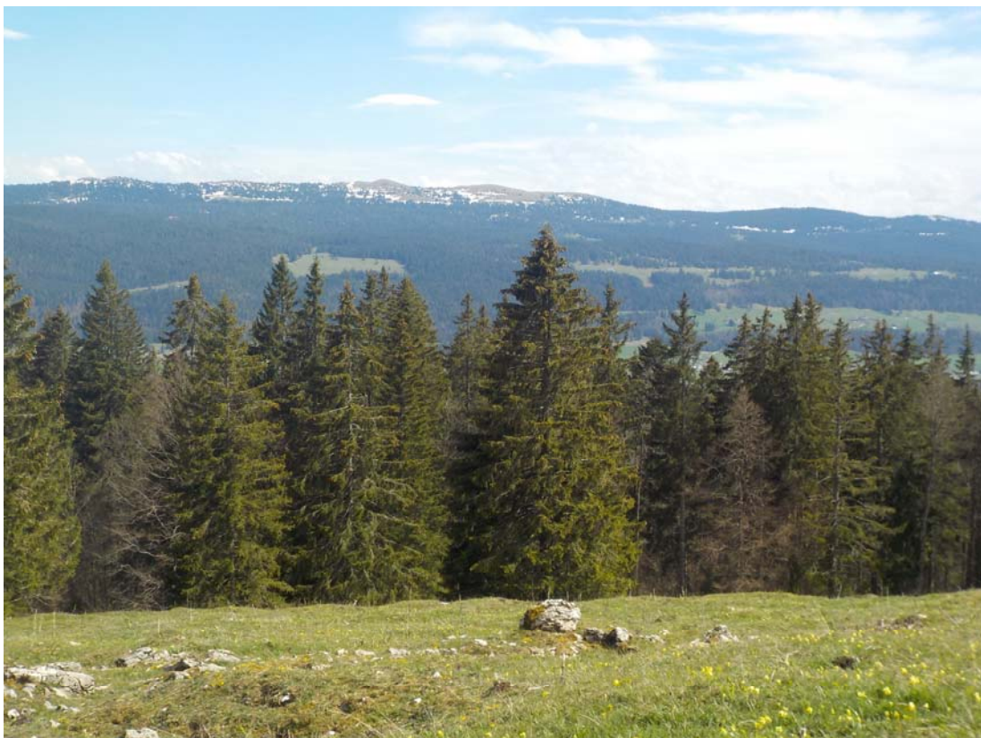
Et contre l'orient, la vaste chaîne du Mont-Tendre encore passablement enneigée en ce dimanche 9 mai 2021.