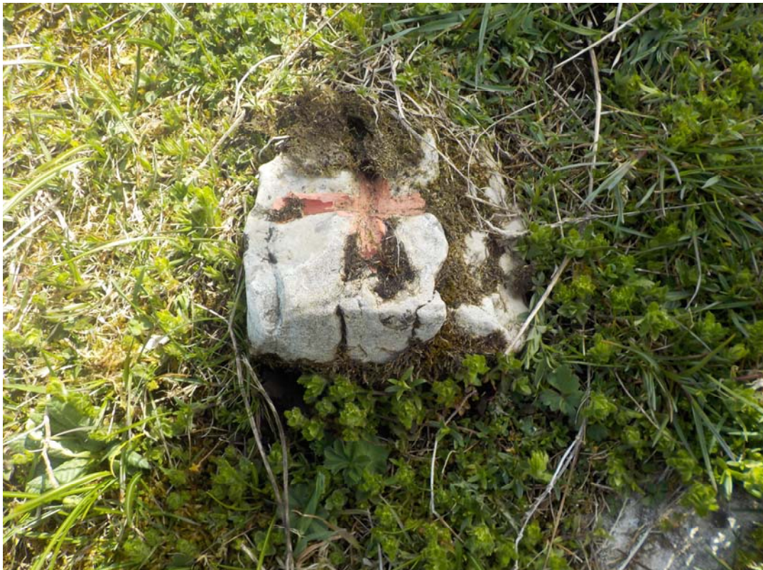
A proximité une borne en apparence plus ancienne.