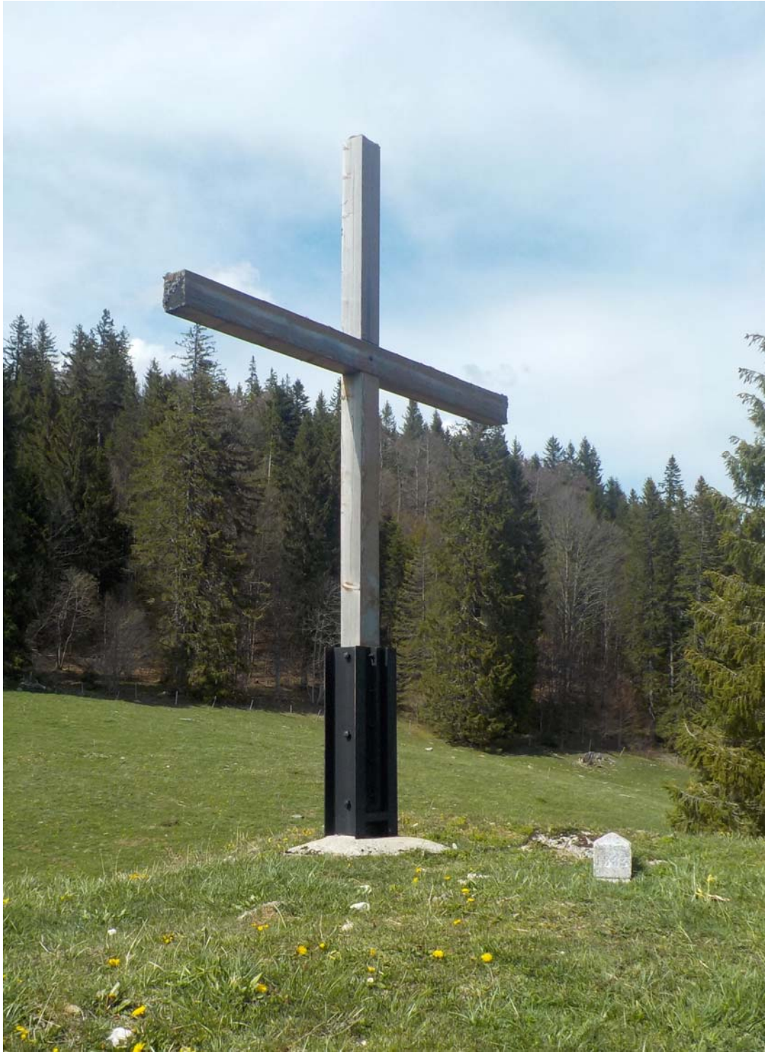
Croix et borne. La croix figure tout le passé protestant de la commune du Lieu, en particulier celui de la jeunesse de l'endroit.