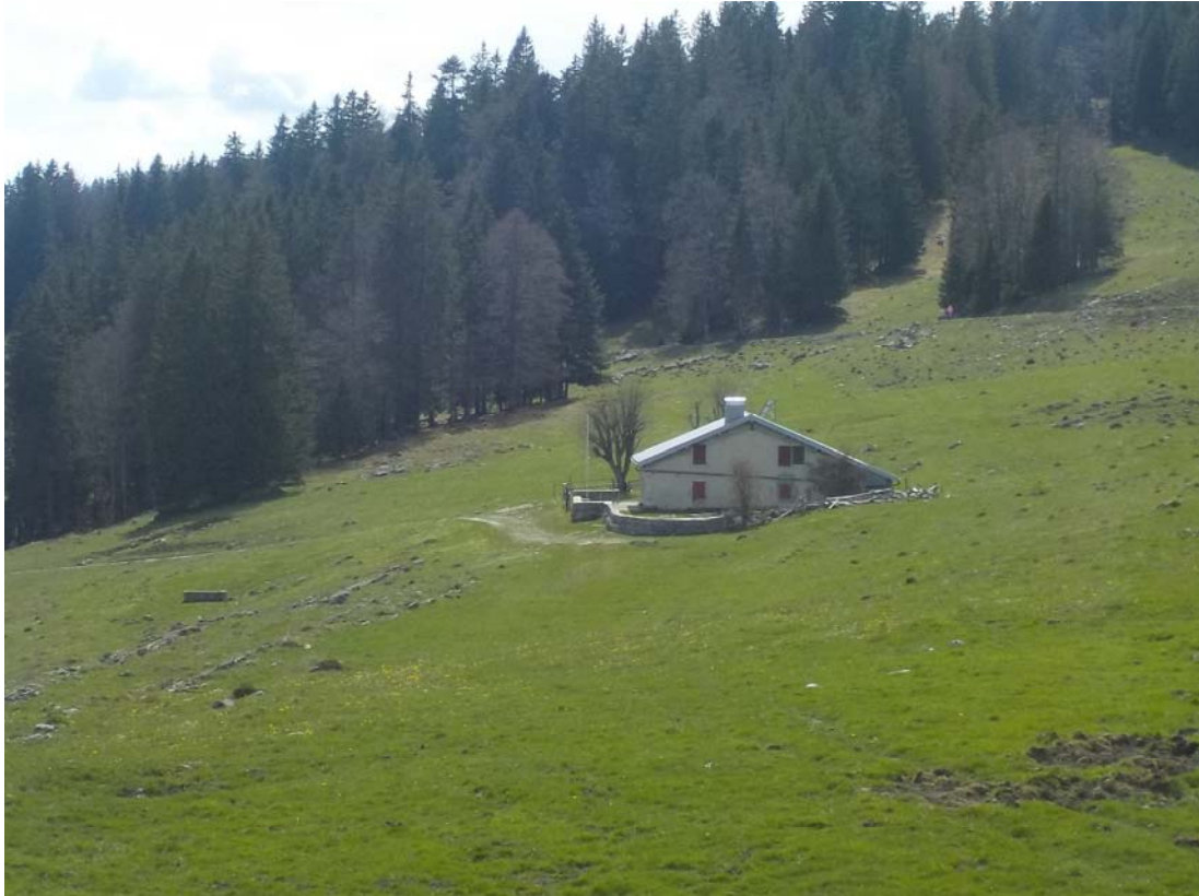
Contre l'ouest, la cabane du Levant