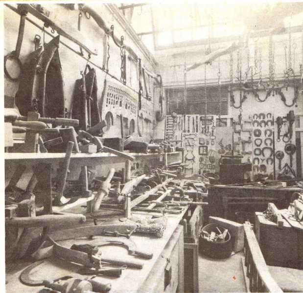
Une partie de la collection concernant en particulier le cheval.

objets, constituant en quelque sorte les «livrets de famille» de ces objets.