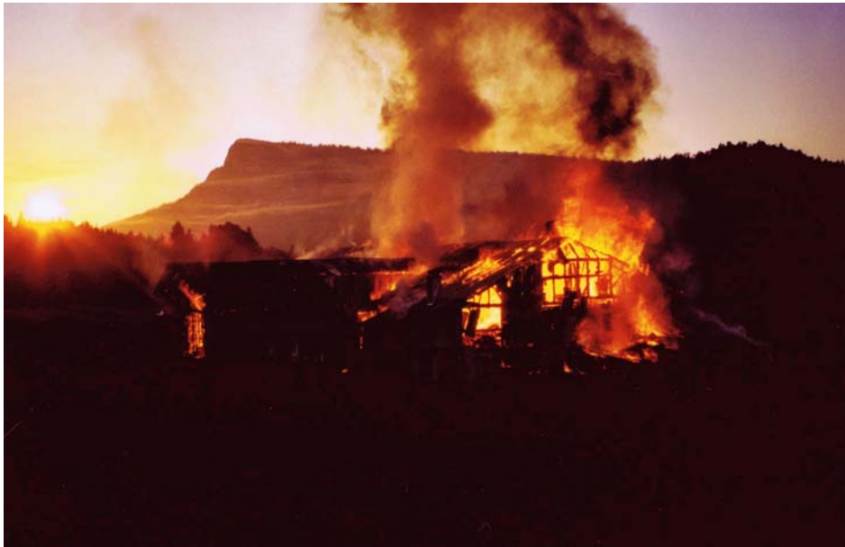
Aube du 20 juin 2000. L'Épine-Dessus achève déjà de brûler dans une vision titanesque et malgré tout d'une beauté surprenante.

inchangé depuis l'origine, je le trouvai plus beau que jamais. J'eus une pensée de reconnaissance pour ses constructeurs. Sa pureté esthétique m'alla droit au cœur. Il était admirable, vraiment, dans ses formes certes très simples, mais offrant une vraie harmonie où rien, aucun élément, lui serait disparate, ne heurte. Et malgré ce que j'avais vu le matin, qu'on me pardonne, ne voyez pas de mal à cela, par cette vision presque majestueuse, je fus heureux, simplement, profondément.