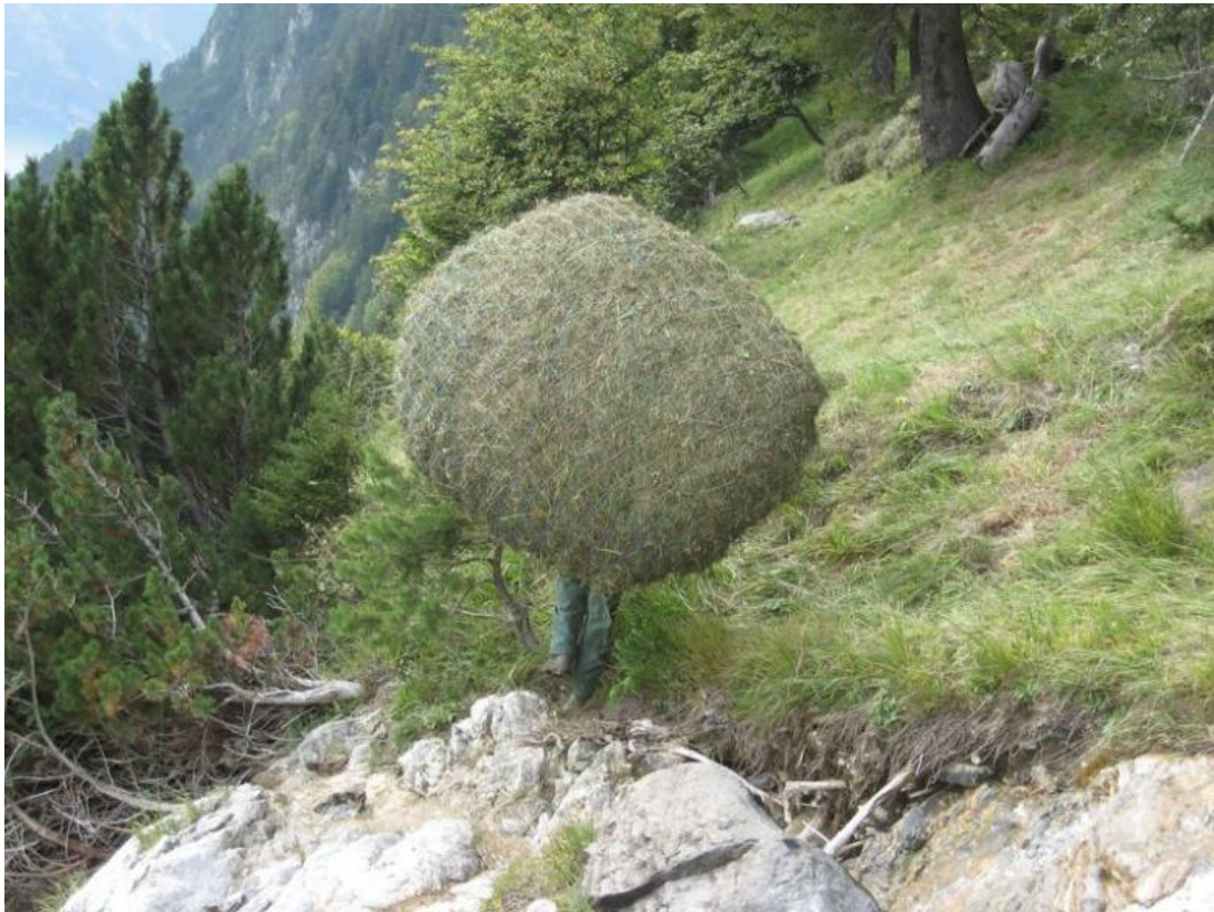
La récolte du fourrage par le biais du filet dans les Alpes. Là son usage est plus évident.