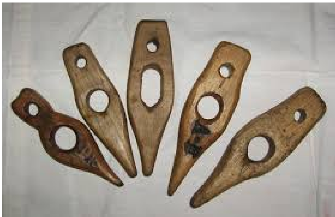
Clés à foin.