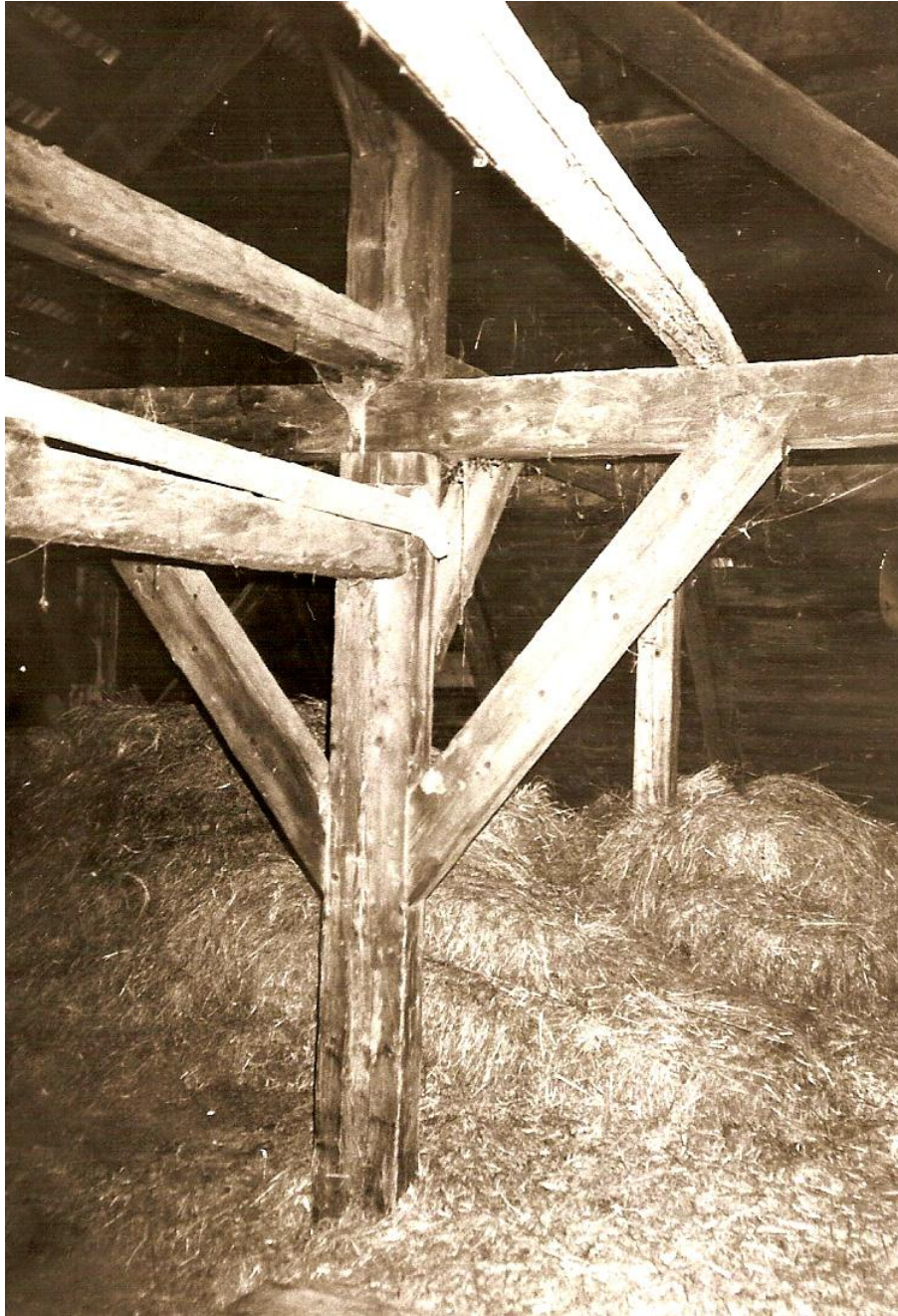
Une belle charpente de chalet toute mortaisée et chevillée.

MORTAISAGE ( tè-za-je ) n. m. Action de mortaiser : le mortaisage d'une pièce de bois.