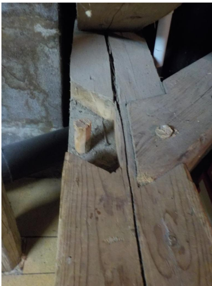
Mortaise et tenons.

Ceci dit considérons que la bisaiguë a accompagné nos anciens charpentiers dans tous les travaux qu'ils ont pu accomplir dans le domaine de la construction de charpente. Les mortaises, ils connaissaient. Ainsi que dessous :