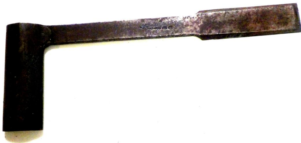
La pontache, 40 cm de long, sorte de demi bisaiguë. Collection Debonneville, 2025.