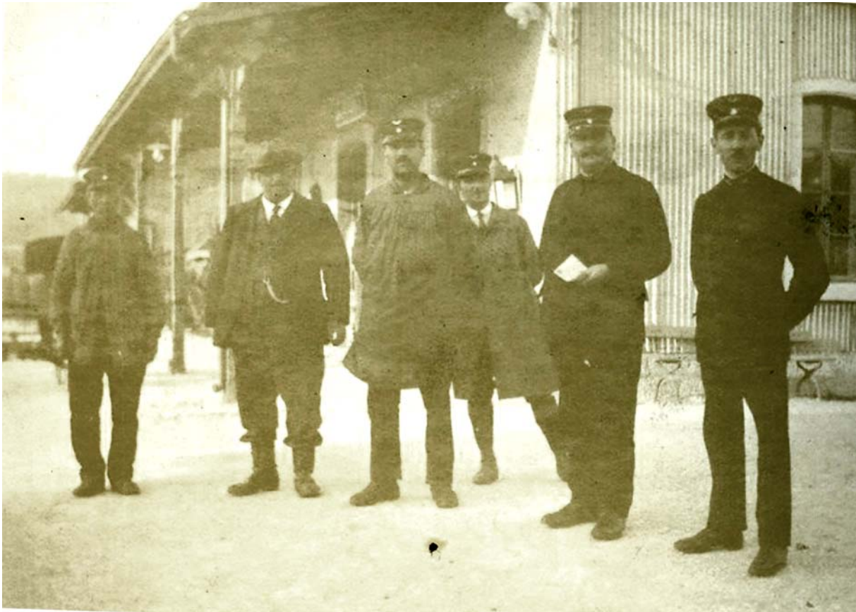
Personnel de la gare du Pont. Personnages hélas désormais anonymes.