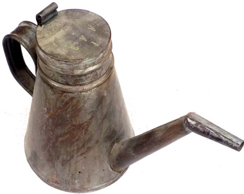
Burettes de chemin de fer.