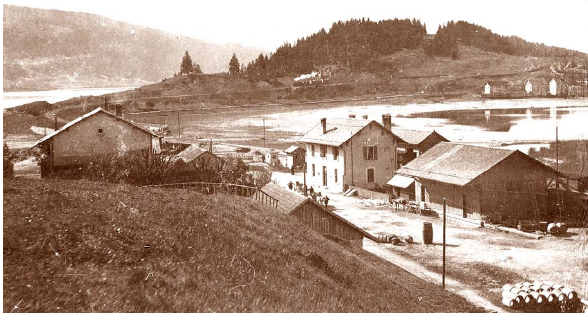
Grande activité dans les alentours de la gare du Pont.