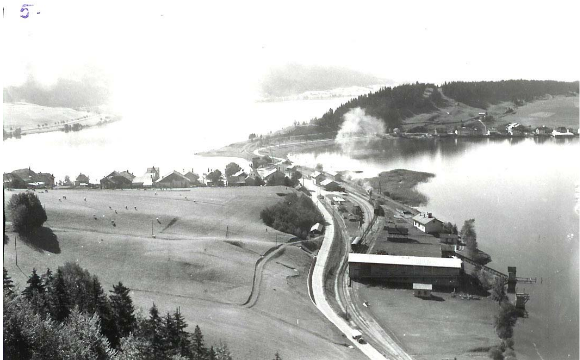
Le temps de la vapeur certes, mais aussi celui des glaciers du Pont.