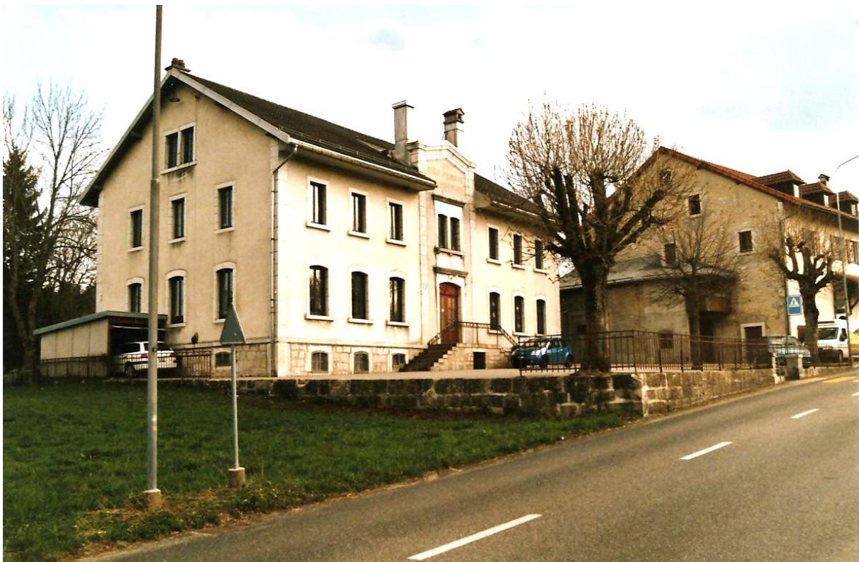
Collège des Charbonnières vers 2002.

Et ce sera le centième du collège bâti en 1876 :