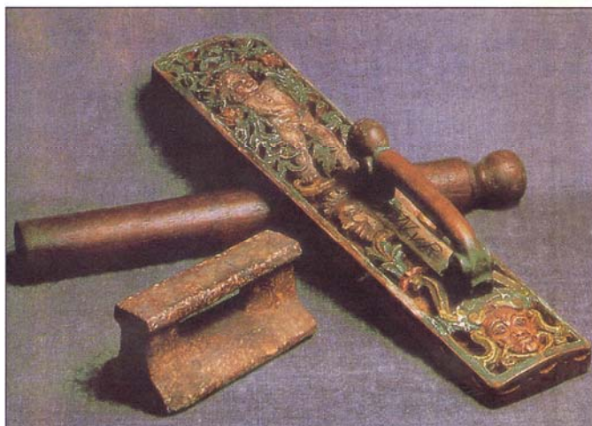
Rouleau à calandre scandinave.