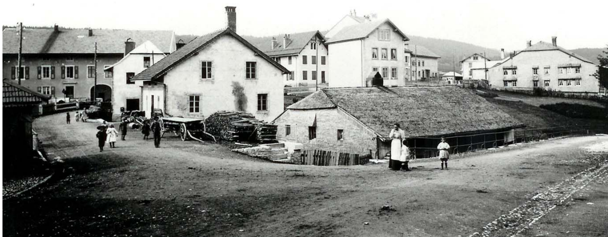
Le vieux moulin tel qu'il se présentait encore au début du XXe siècle. Le battoir se serait trouvé au fond du vallon, à droite de la photo.