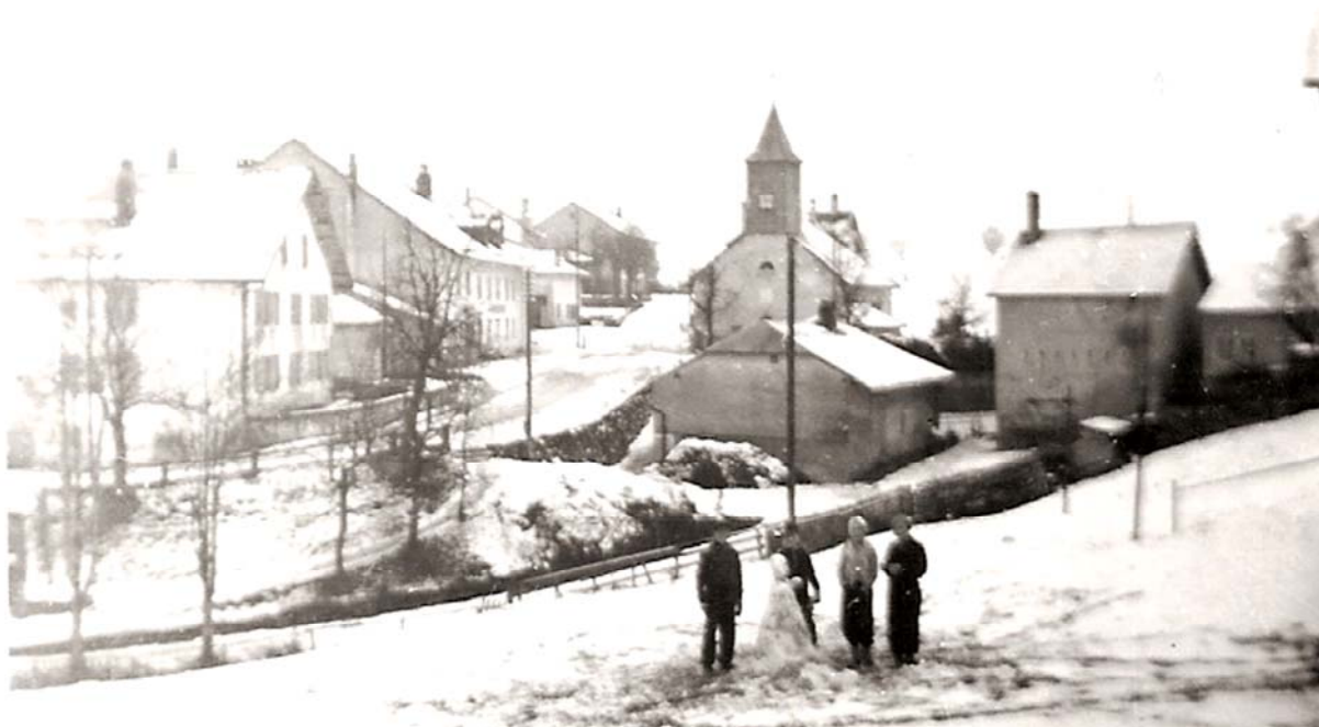
Le vallon de la Sagne inférieure tel qu'il se présentait vers 1930, avec la présence parmi ces quatre enfants du petit-fils de Constant Bélaz, ancien laitier, propriétaire de la maison Pitôme, partie orientale. A l'arrière plan, sur la partie de droite, le vieux moulin, l'église, la laiterie et la boulangerie. Depuis lors ce vallon a été comblé en grande partie.